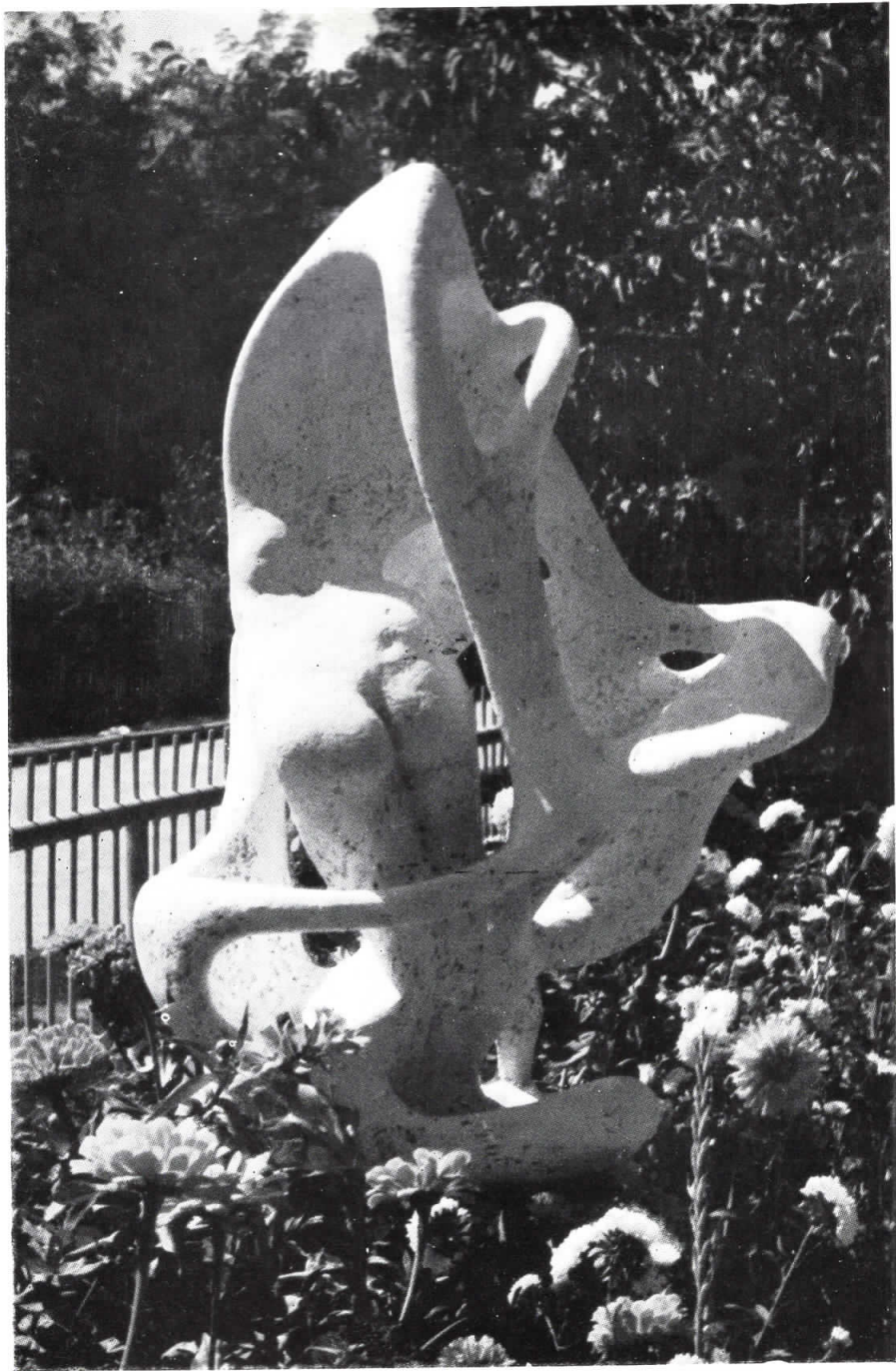
34. Љубовна игра, гипс