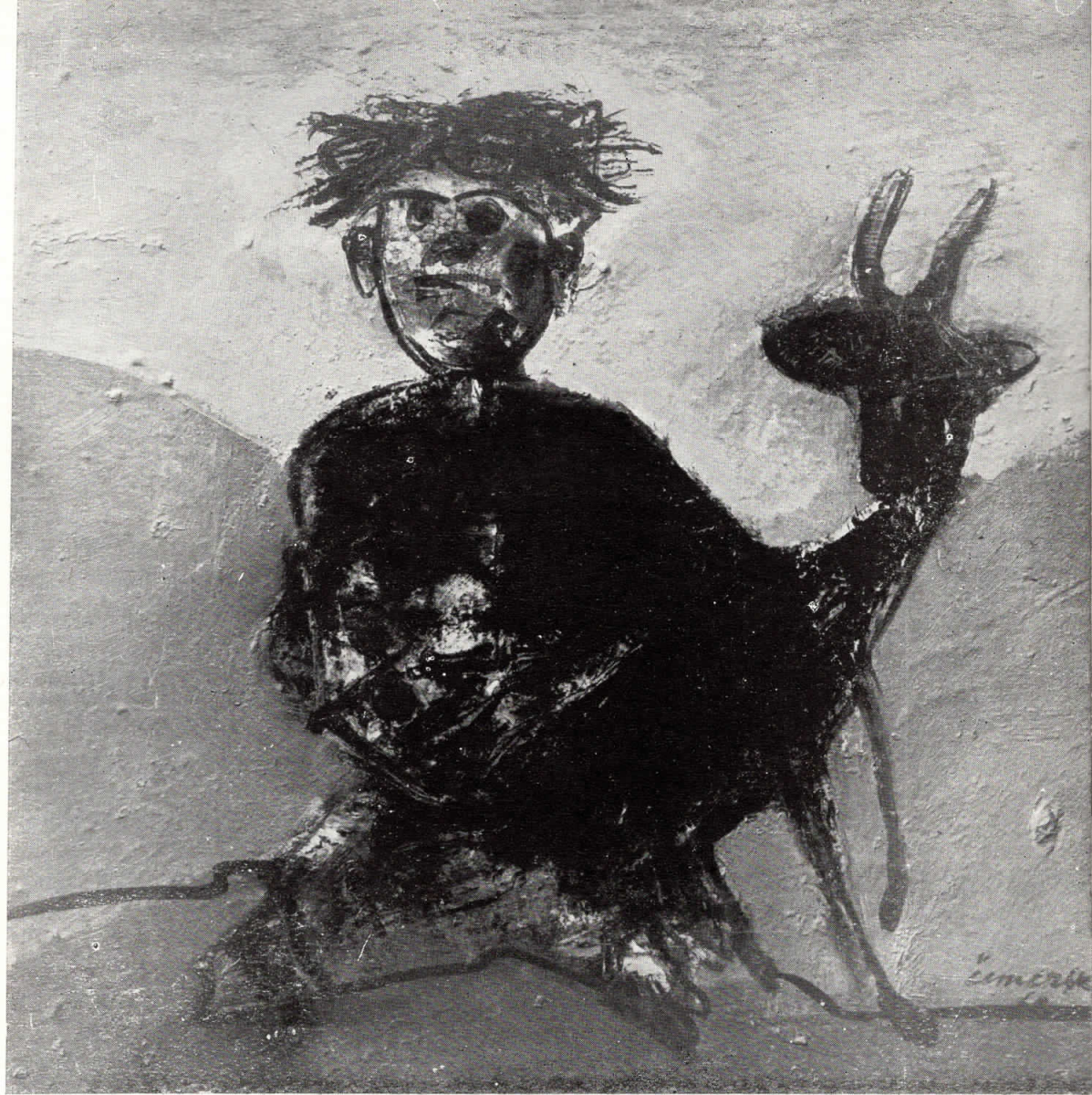
راعي قطيع العنز LITTLE GOAT — HERD