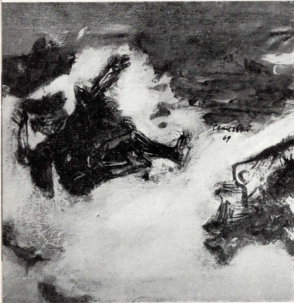
هيب الصيف SUMMER FLAME