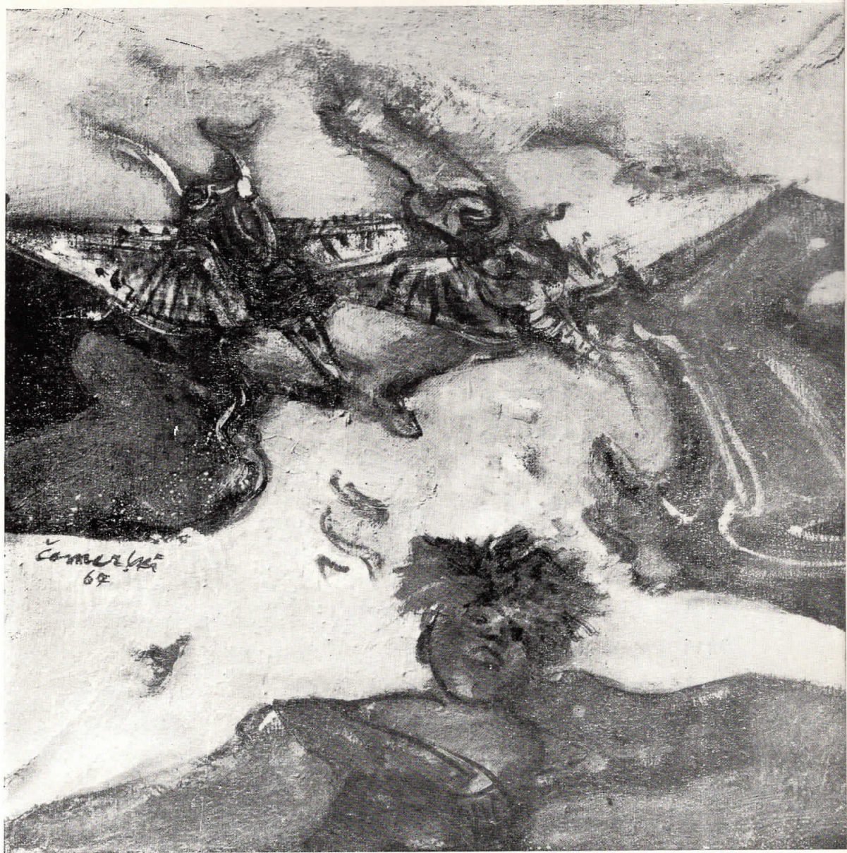
الفزع وسط النهار MIDDAY — FEAR