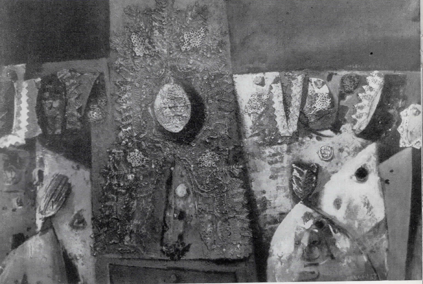
ЛЕГЕНДА ЗА ЛЕВОТ МЕШ. ТЕХ. И КОЛАЖ 1965