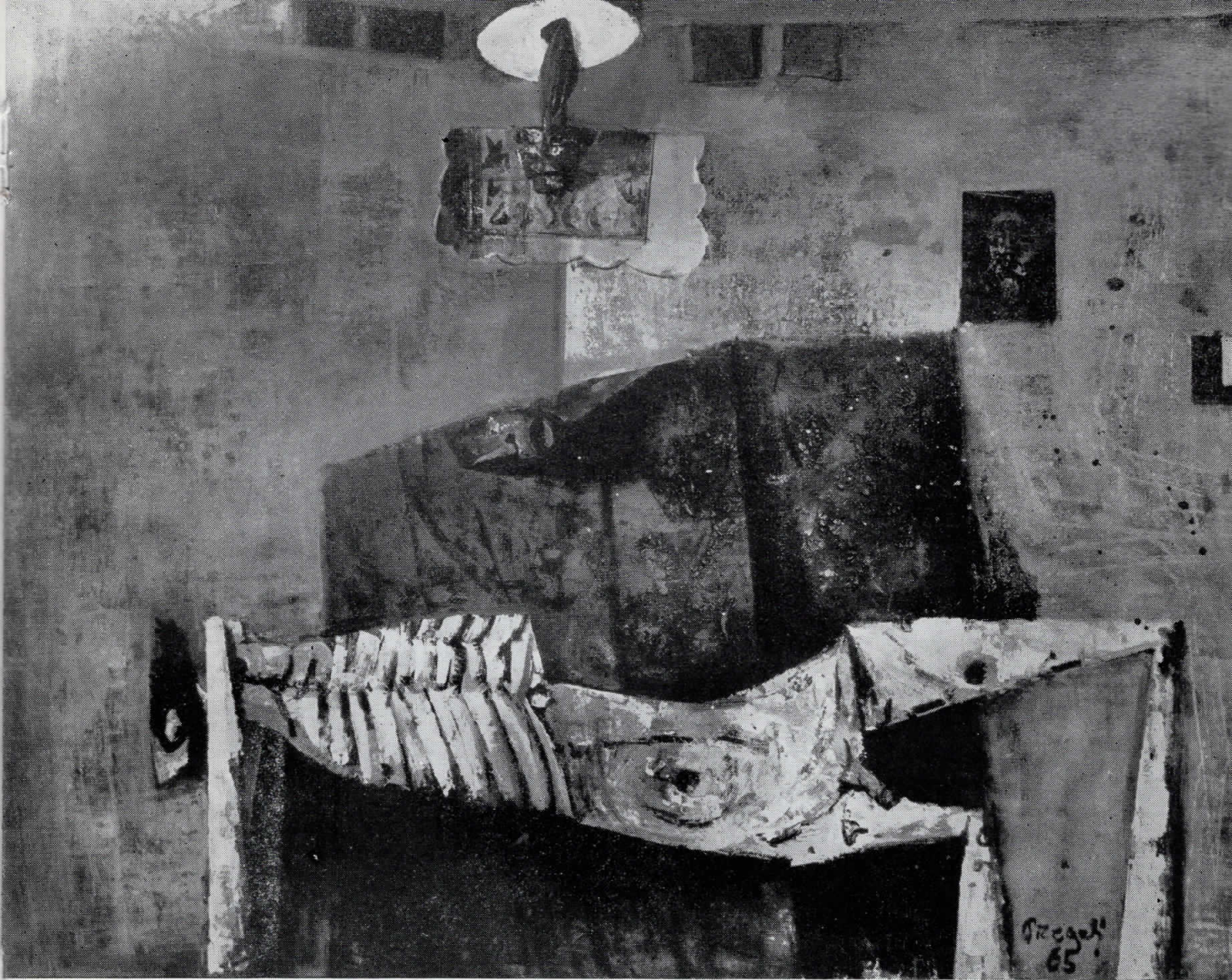
ПИЕТА МЕШАНА ТЕХНИКА 1965