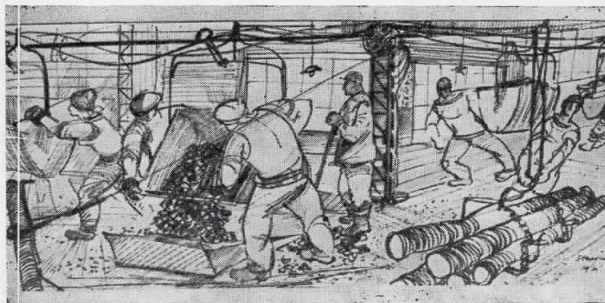
1. Czinke Ferenc -- Класификација на јаглен