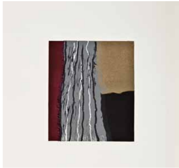
Галичник IV, линорез, 30x30см., 2011. Galicnik IV, linocut, 30x30cm., 2011.