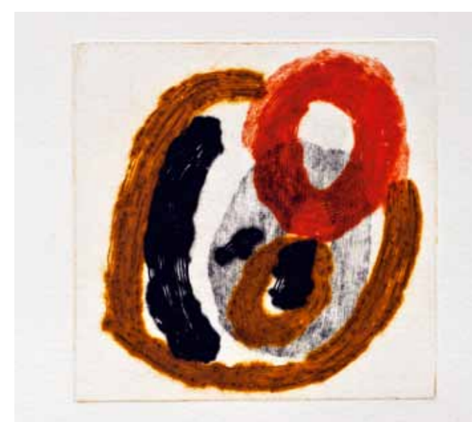
Булка V , сува игла, 20x20см., 2011. Poppy V , dry point, 20x20cm., 2011.