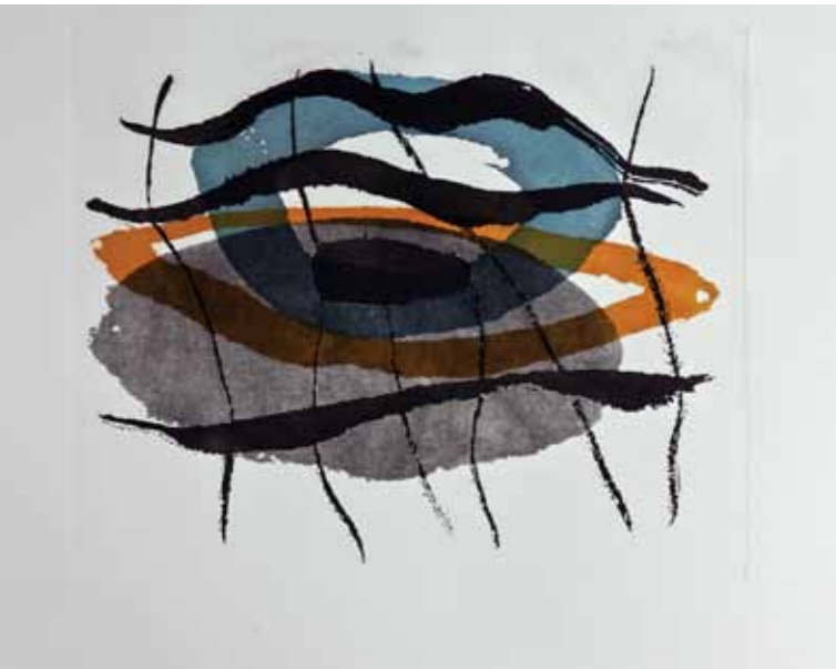
Водени прстени , акватинта, 60x70см., 2012. Water rings , aquatint, 60x70cm., 2012.

при што како главни „наратори“ се присутни фрагментите од видената / доживеаната (лична) реалност пренесена со асоцијативни апстрактни форми. Во графичките отпечатоци авторката има тенденција кон перфекција за извлекување максимум од техниката, додека нарацијата карактеристична за препознатливиот творечки јазик на Јанешлиева е само навидум отсутна – таа се јавува како навестување, шум, далечно ехо во изборот на насловите на делата, кои сугерираат поетика на чувствувањето на моменталните минливи „импресии“.