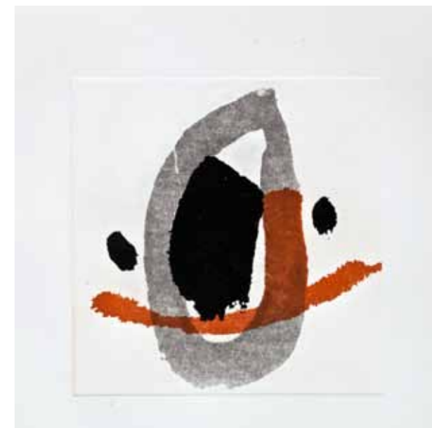
Коала, акватинта, 30x30см., 2012. Koala face, aquatint, 30x30cm., 2012.