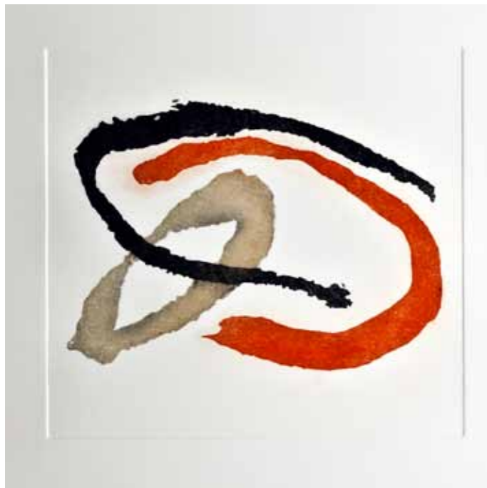
Вода, акватинта, 30x30см., 2010. Water, aquatint, 30x30cm., 2010.