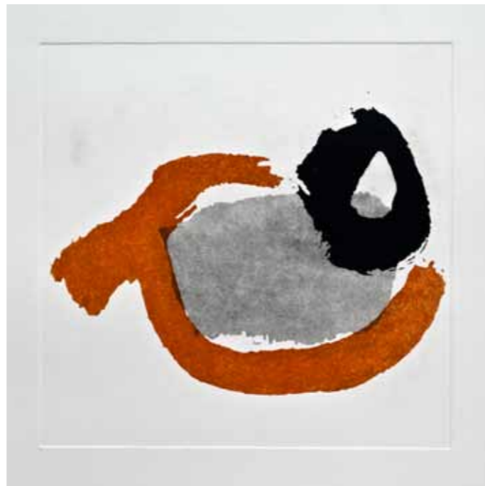
Мачка, акватинта, 30x30см., 2012. A Cat, aquatint, 30x30cm., 2012.