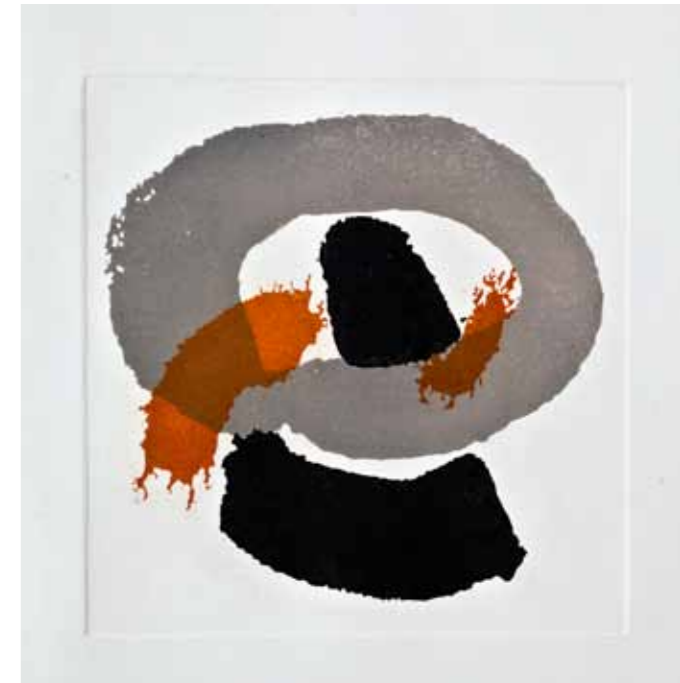
Танчерка , акватинта, 30x30см., 2012. A Dancer , aquatint, 30x30cm., 2012.

The other two cycles “Poppies” (2011–2012) and “Impressions” (2012) deal with nature, or to be more precise, the flora. They represent a confrontation with impressions through forms with lineary treated details. The dry point technique used in these prints, enables the artist to create poetical segments i.e. representations of reality expressed by subtle quivering movements meticulously produced and with emotional rhythmically charged moment. Finally, in the fifth cycle entitled “Galicnik” (from 2011, created in linocut and intaglio) the representations of a number of sets of painted surfaces, which as compositions