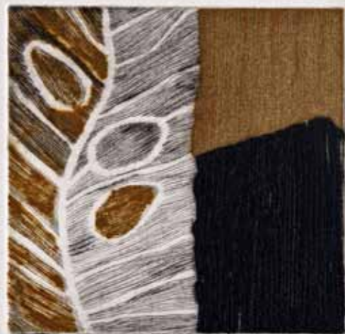
Впечаток III, сува игла, 20x20см., 2012. Impression III, dry point, 20x20cm., 2012.