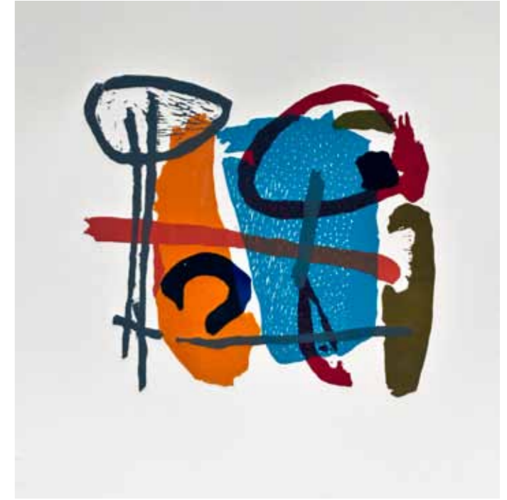
Море I, линорез, 35x35см., 2009. A Sea I, linocut, 35x35cm., 2009.