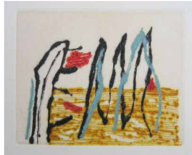
Булка IV, сува игла, 20x20см., 2011. Poppy IV, dry point, 20x20cm., 2011.