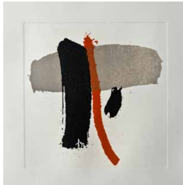
Одоната, акватинта, 30x30см., 2012. Odonata, aquatint, 30x30cm., 2012.