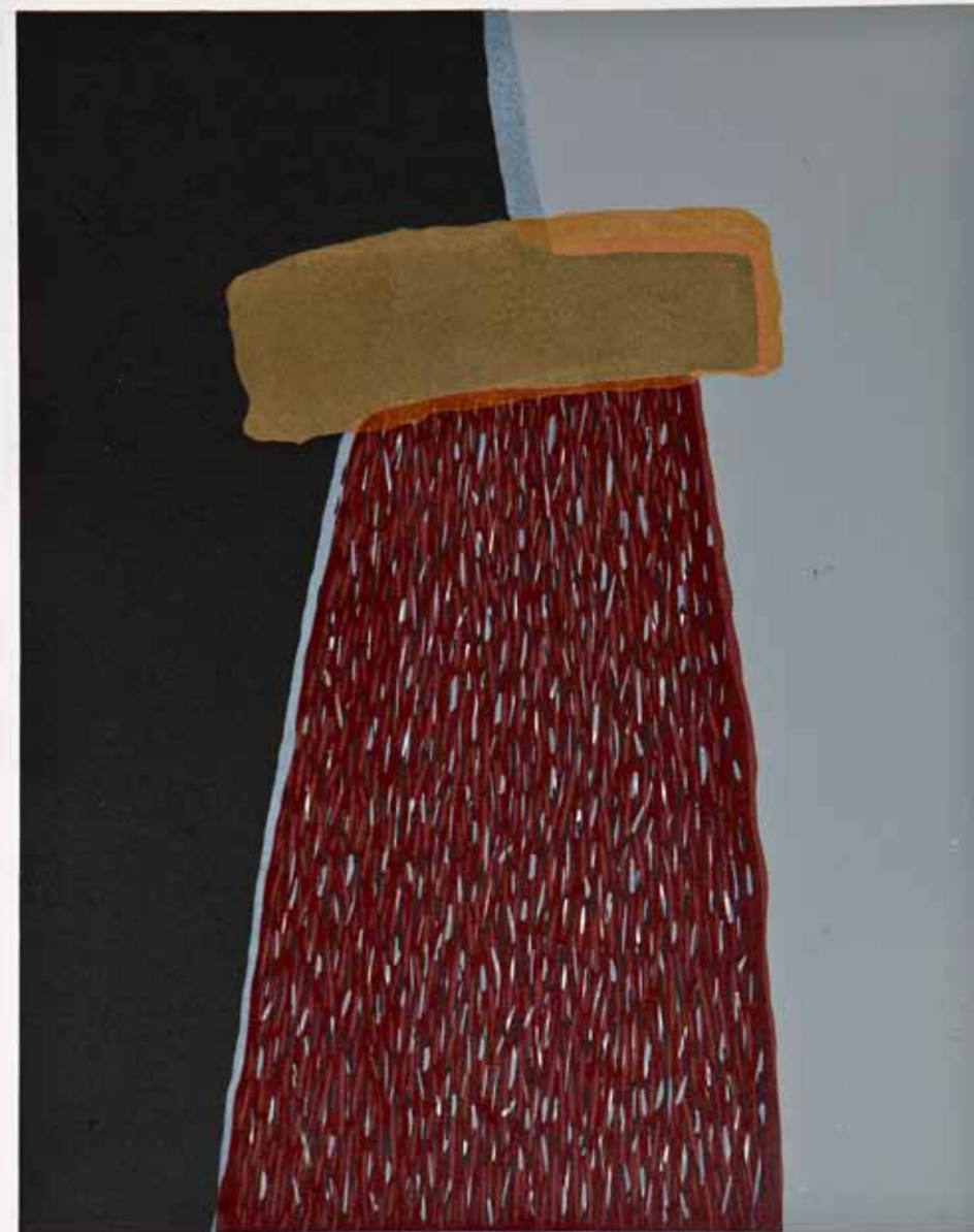
Галичник VIII, линорез, 60x50см., 2012. Galičnik VIII, linocut, 60x50cm., 2012.