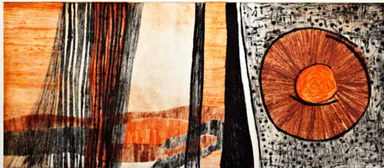
Плодност, сува игла, 45x85см., 2007. Fertility, dry point, 45x85cm., 2007.