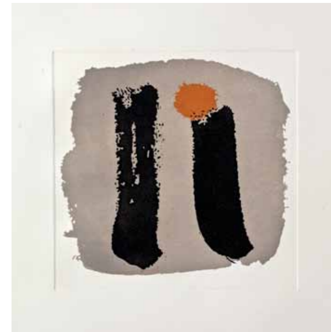
Разговор, акватинта, 30x30см., 2012. Conversation, aquatint, 30x30cm., 2012.