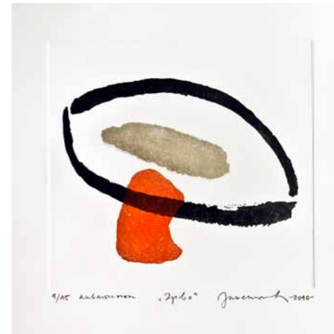
Древо, акватинта, 30x30см., 2010. A Tree, aquatint, 30x30cm., 2010.

In the first cycle of prints entitled “Haiku” (2010-2012), which according to