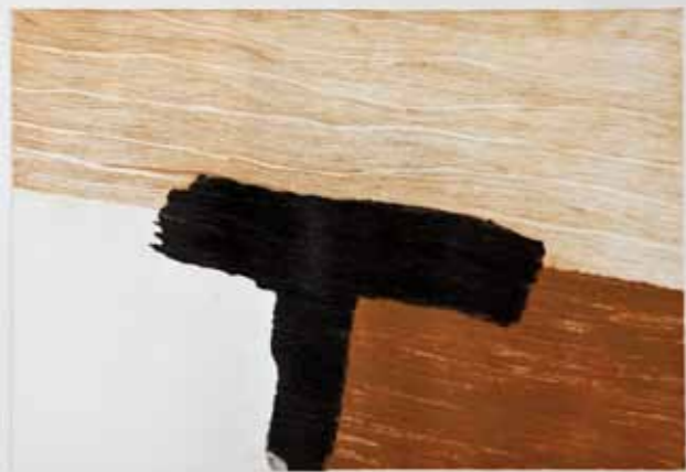
Впечаток IV, сува игла, 45x60см., 2012. Impression IV, dry point, 45x60cm., 2012.