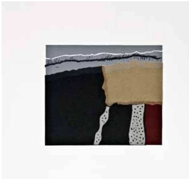
Галичник V, линорез, 30x30см., 2011. Galičnik V, linocut, 30x30cm., 2011.