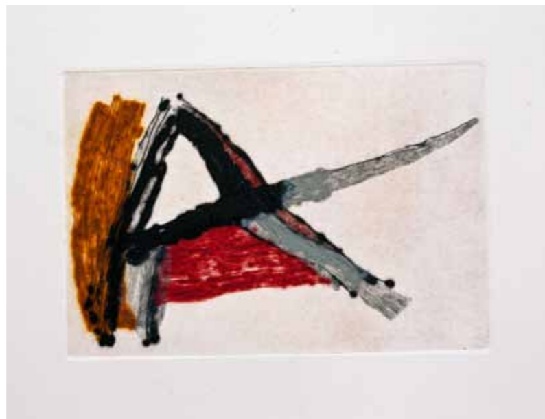
Булка II , сува игла, 20x25см., 2011. Poppy II , dry point, 20x25cm., 2011.