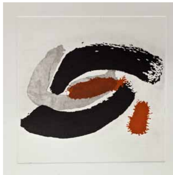
Риби, акватинта, 30x30см., 2012. Pisces, aquatint, 30x30cm., 2012.