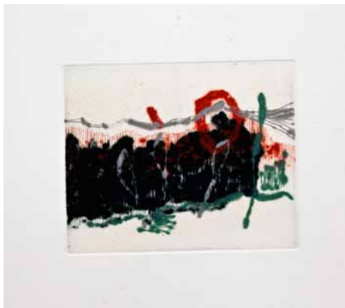
Булка I , сува игла, 20x20см., 2011. Poppy I , dry point, 20x20cm., 2011.