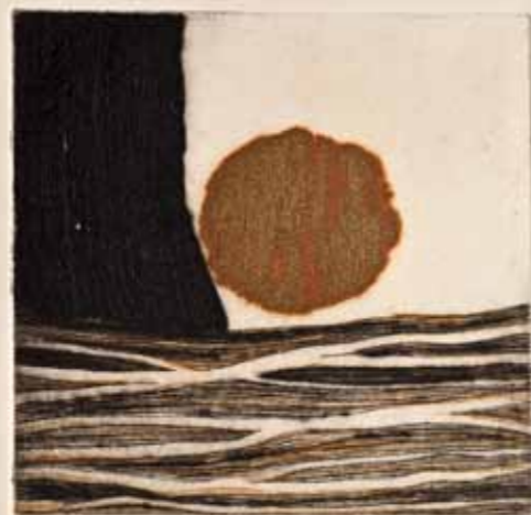
Впечаток II, сува игла, 20x20см., 2012. Impression II, dry point, 20x20cm., 2012.