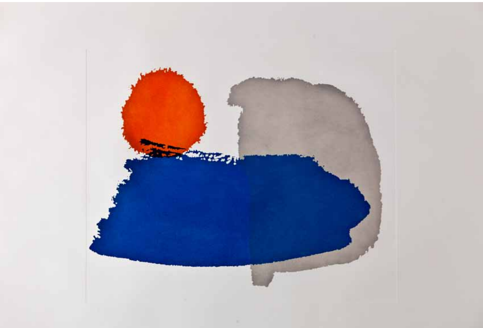
Сонце, карпа и море, акватинта, 60x70см., 2012. Sun, rock and sea, aquatint, 60x70cm., 2012.