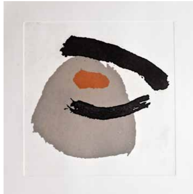
Прегратка , акватинта, 30x30см., 2012. A Hug , aquatint, 30x30cm., 2012.

the treatment could be defined as a sign sketch drawing, Janešlieva creates her movement of the brush to perfection, while in the process of printmaking she experiments with the technique aquatint in the attempt to find the best ways of producing a print which will still keep the whiteness of the background, and will also emphasize the movements. The number of component elements is minimal and reduced just to two colours, so that the perfection of the expression and the purity of the drawing could be achieved. The same tendency is evident in the prints from the second cycle “Haiku 2” (produced in the period between 2009 and 2012) in the technique linocut. They are exceptionally rich in colour and a number of elements comprises their composition.