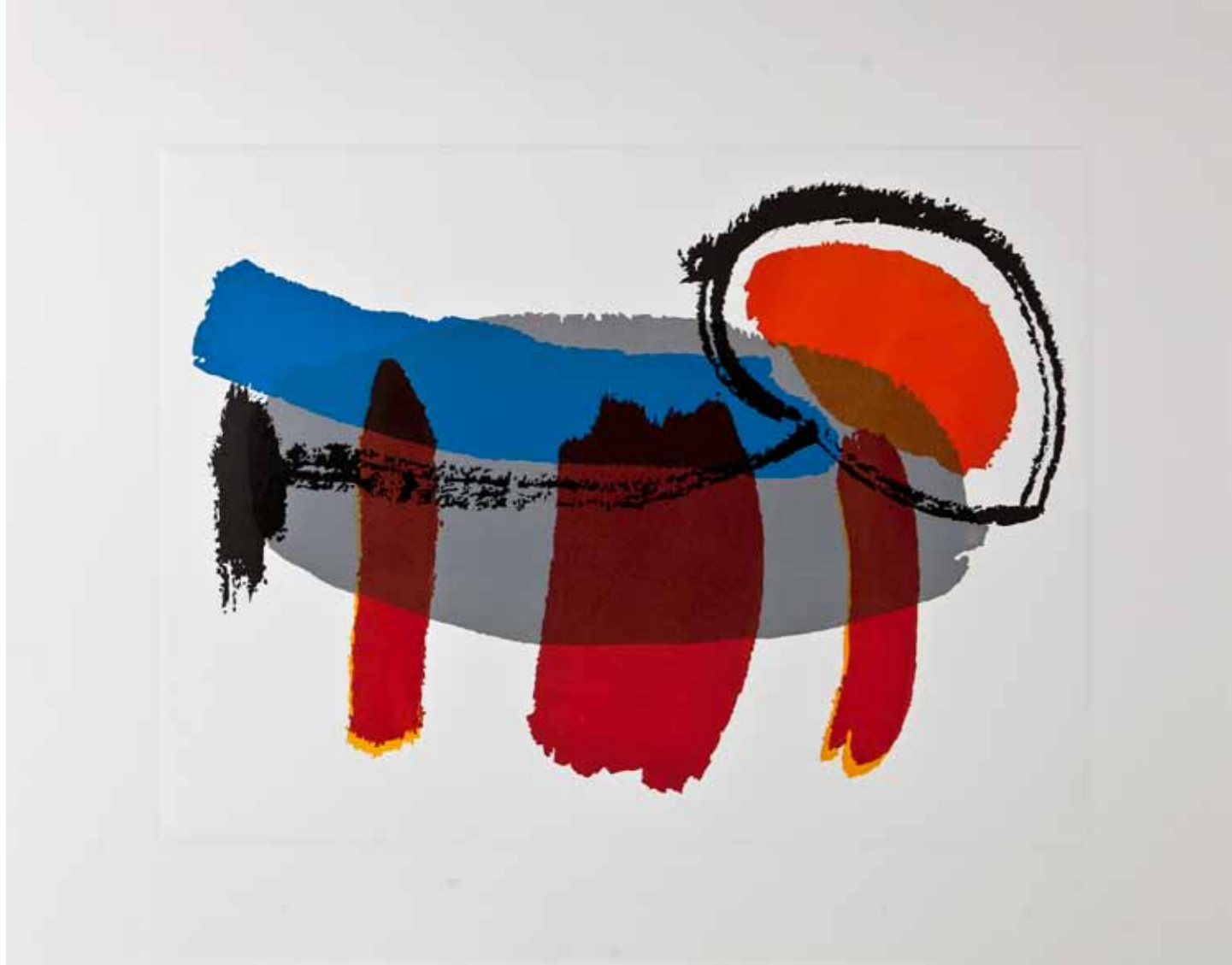
Острова, линорез, 60x70см., 2012. Islands, linocut, 60x70cm., 2012.