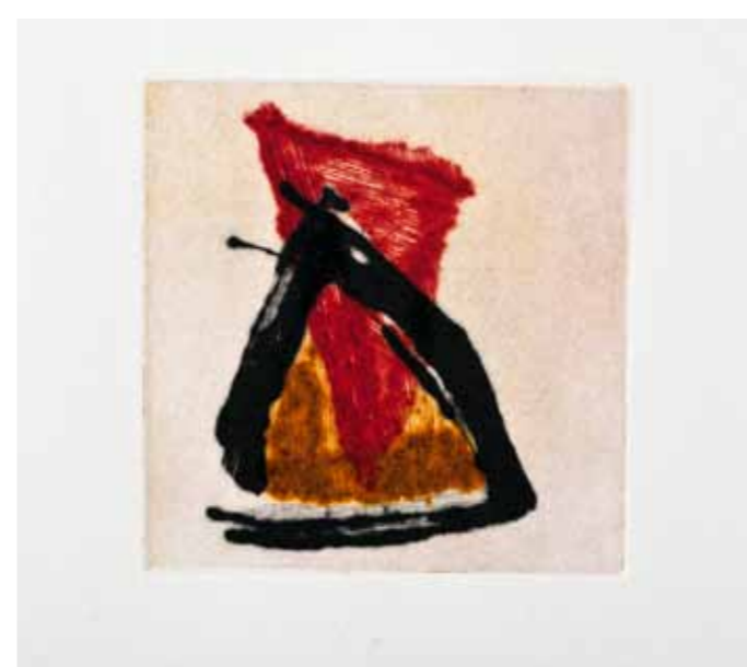
Булка III , сува игла, 20x20см., 2011. Poppy III , dry point, 20x20cm., 2011.