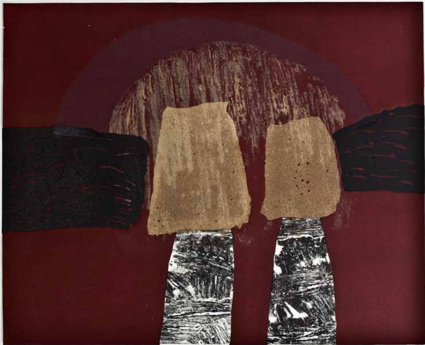
Галичник I, линорез и длабок печат, 50x60см., 2011. Galičnik I, linocut and intaglio, 50x60cm., 2011.