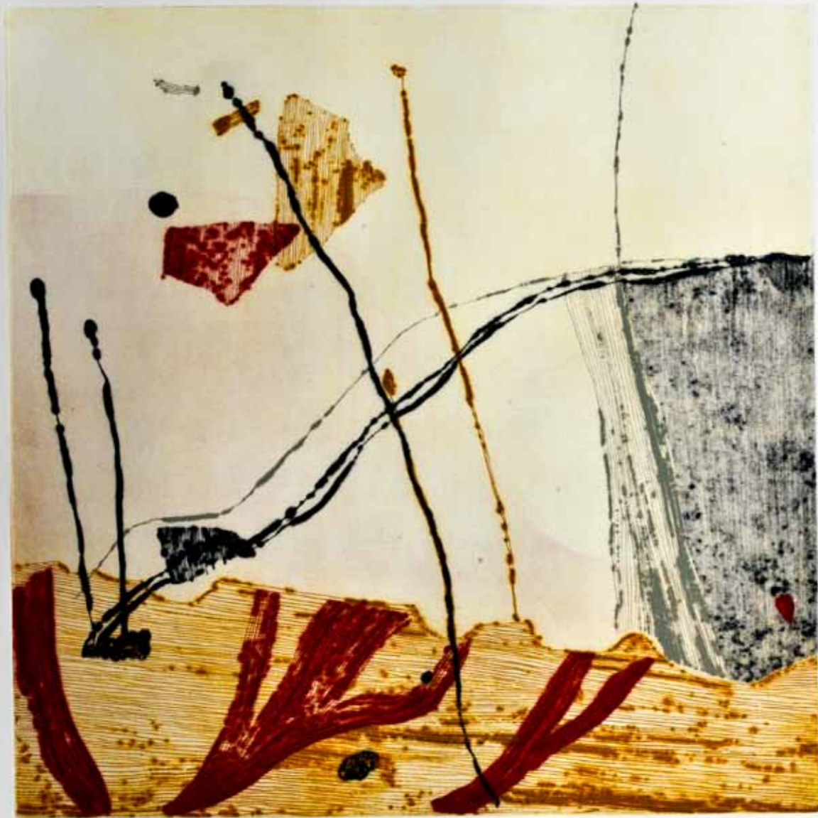
Булка и ветар II, сува игла, 55x55см., 2011. Poppy and wind II, drypoint, 55x55cm., 2011.