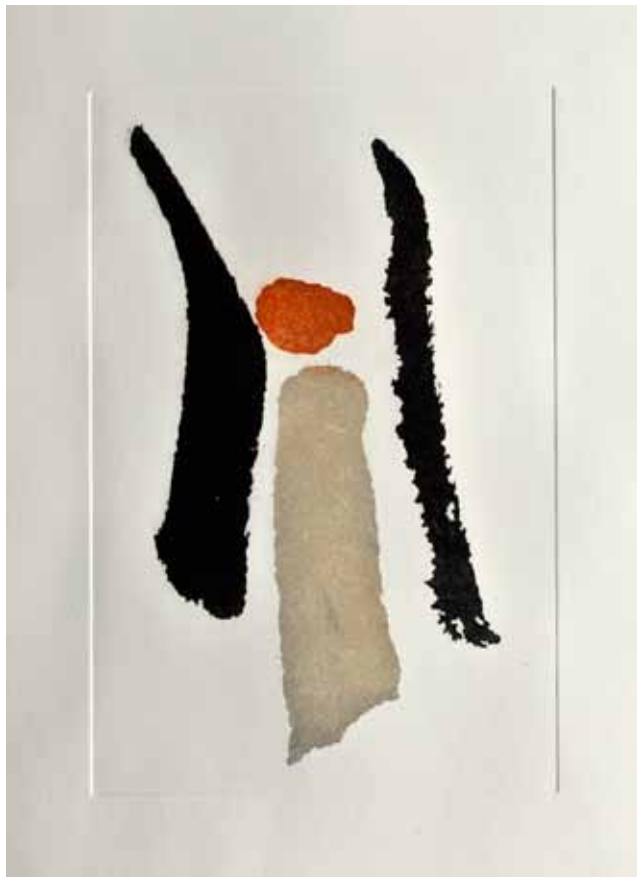
Ангел, акватинта, 40x30см., 2010. Angel, aquatint, 40x30cm., 2010.