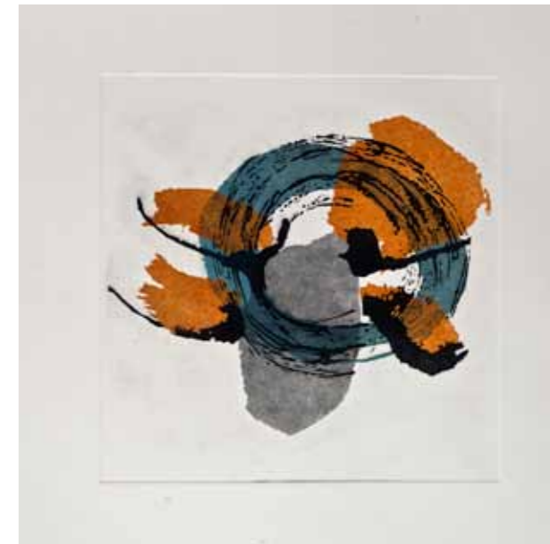
Ветерница, акватинта, 30x30см., 2012. Windmill, aquatint, 30x30cm., 2012.