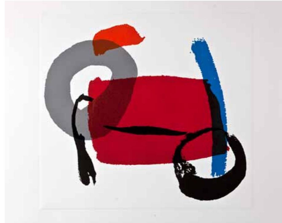
Точка, линорез, 65x70см., 2012. A Bike, linocut, 65x70cm., 2012.