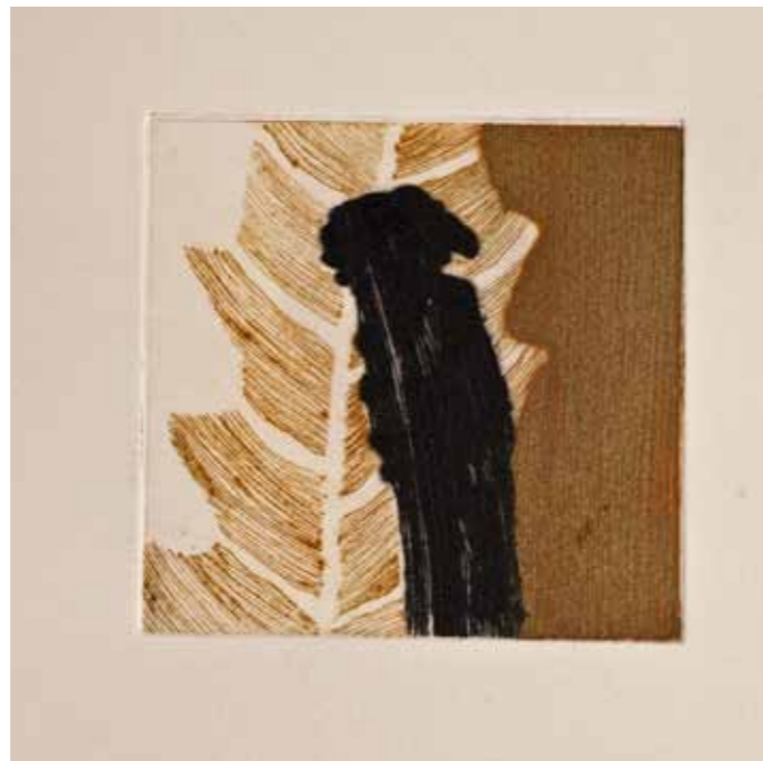
Впечаток I, сува игла, 20x20см., 2012. Impression I, dry point, 20x20cm., 2012.