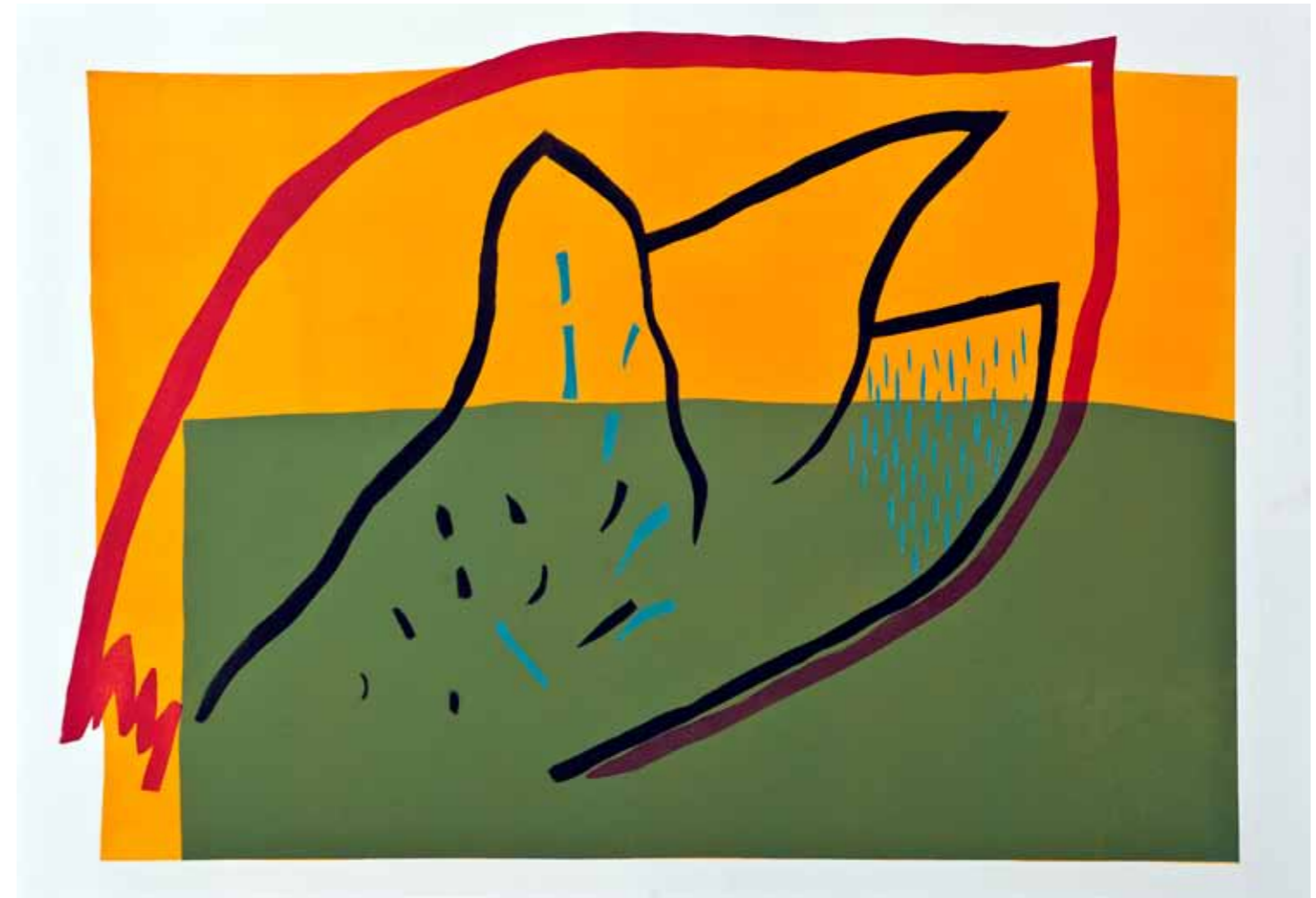
Булка и ветар III, висок печат и шаблон, 50x70см., 2011. Poppy and wind III, relief print and stencil, 50x70cm., 2011.