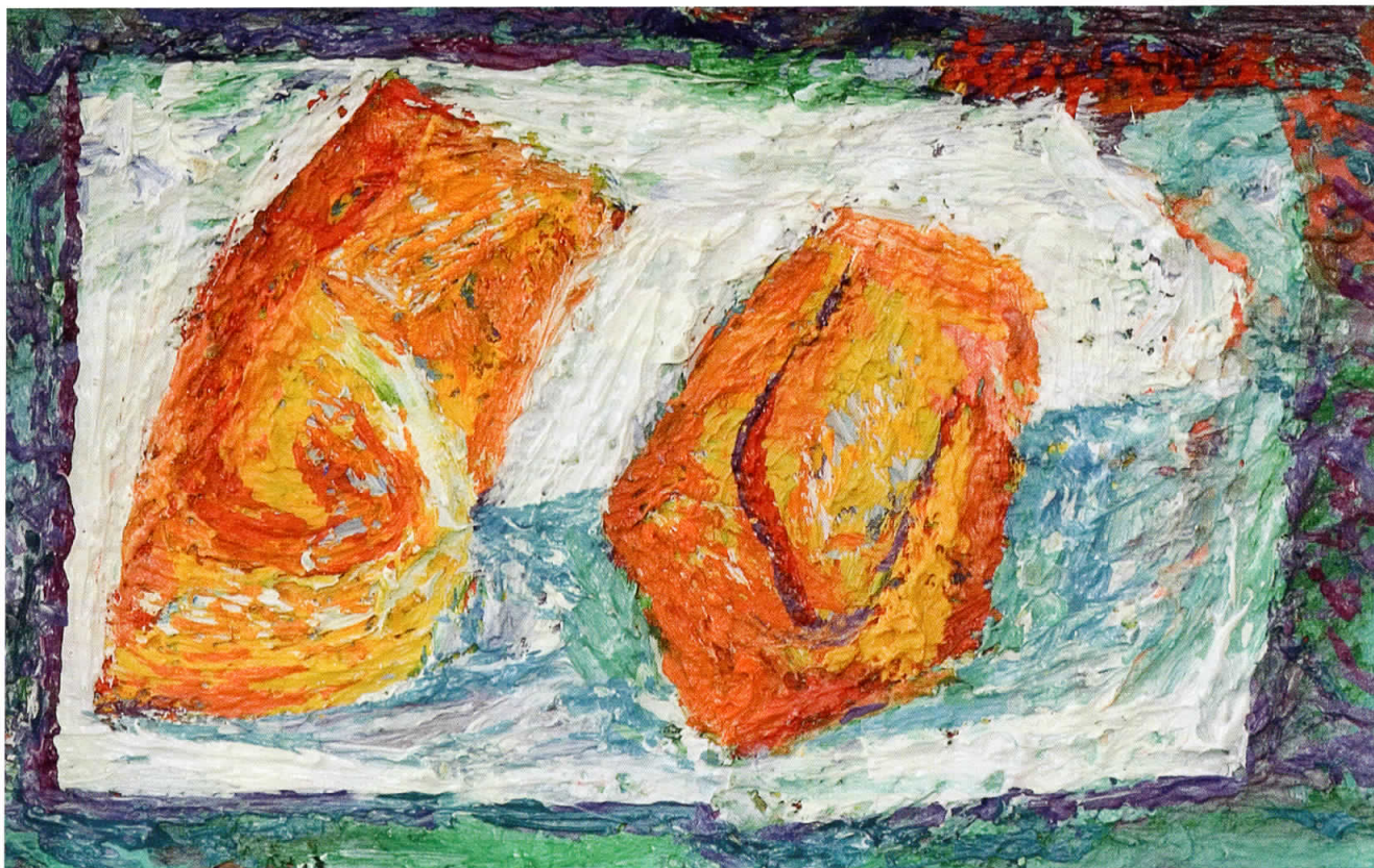
Рефлексии од малите, а големи нешта, 2006, масло на платно, 11 x 17 Reflections from Little but Big Things, 2006, oil on canvas, 11 x 17