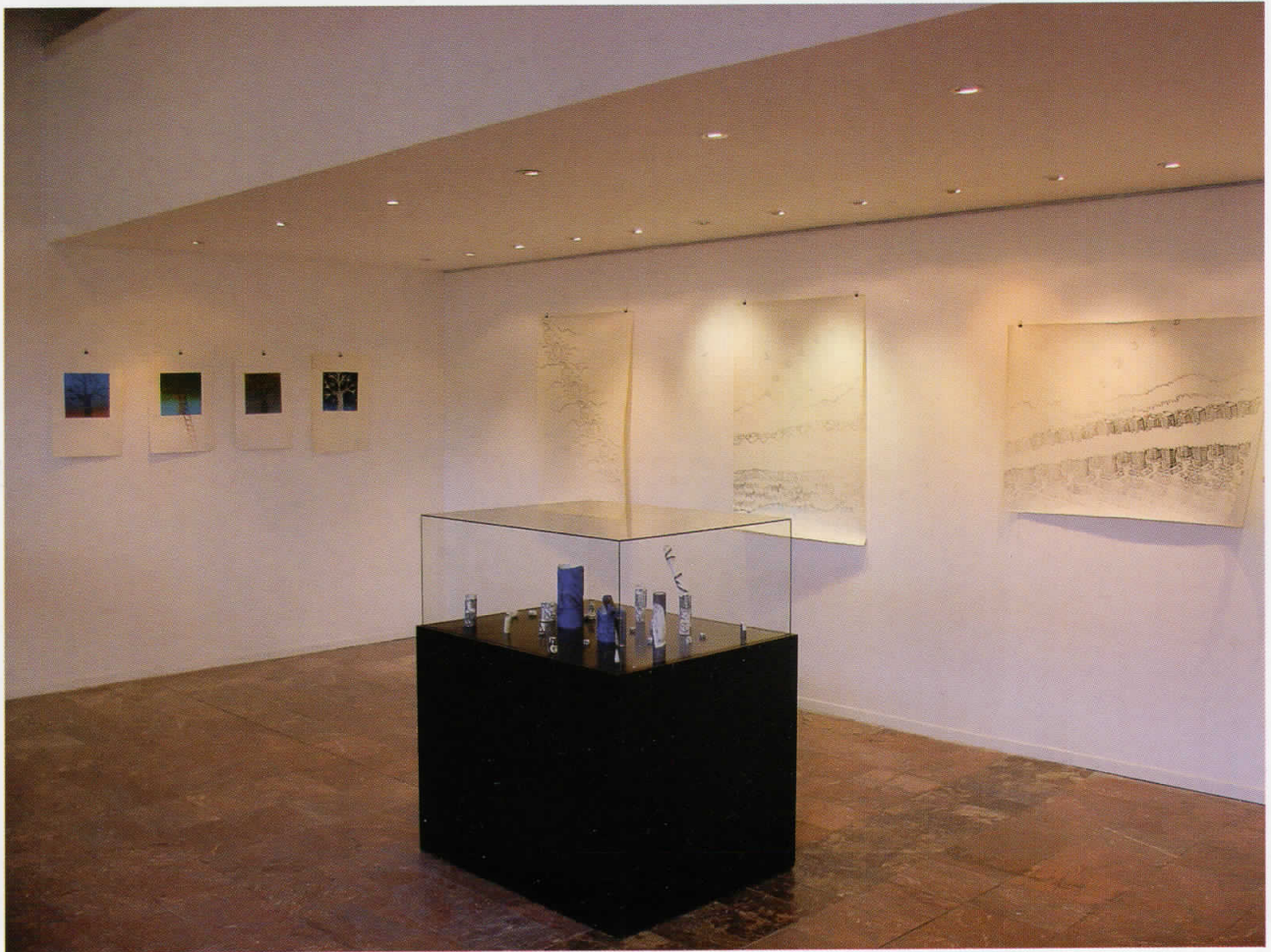
Графичка инсталација, 2007 комбинирани техники Graphic installation, 2007, mixed media