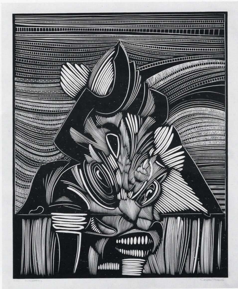
..., 2001 линорез, 63x50 cm ..., 2001, linocut, 63x50 cm