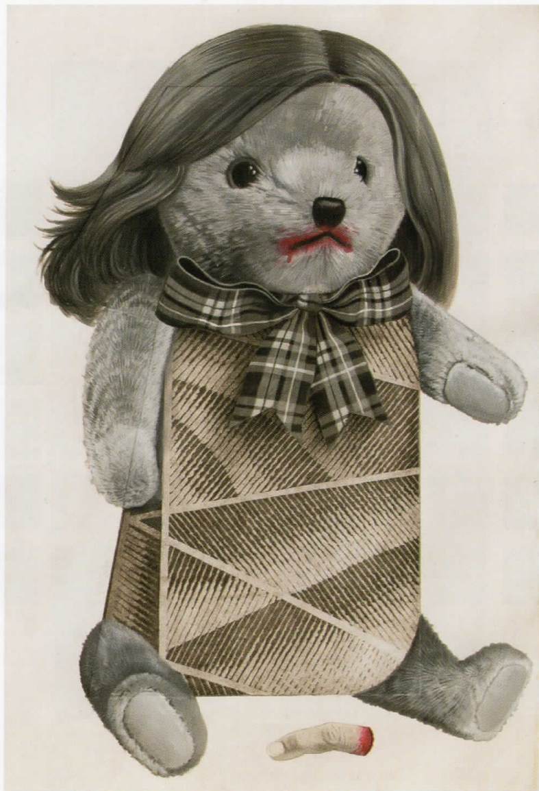
Теди, 2007 акватинта, темпера, 66 x 40 cm Teddy, 2007, aquatinte, tempera, 66x40 cm