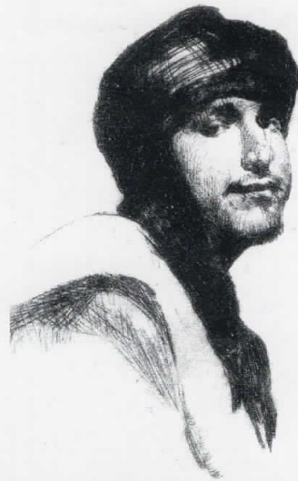
Авѝојорѝреѝ , 2008 сува игла, 8,5x6,5 cm Self-portrait , 2008, dry points, 8,5x6,5 cm