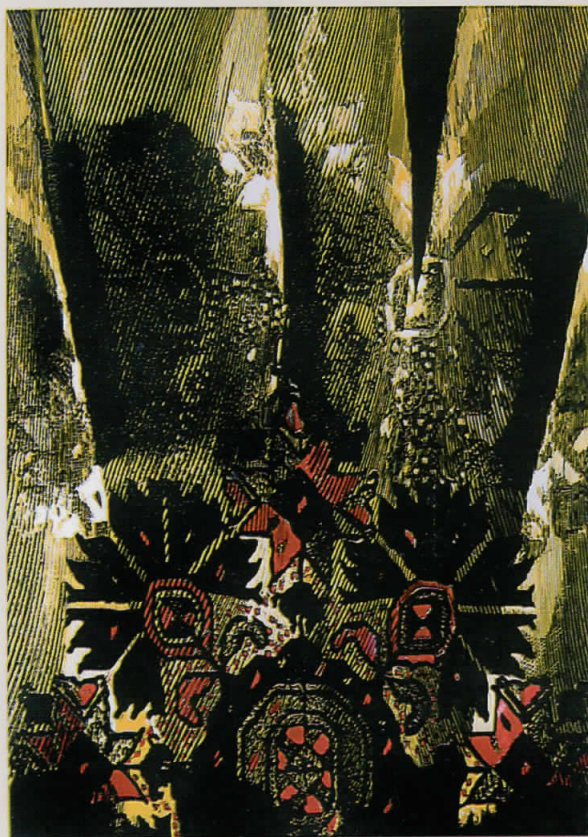
Црно семе, 2008 линорез, 70x50 cm Black seed, 2008 linocut, 70x50 cm