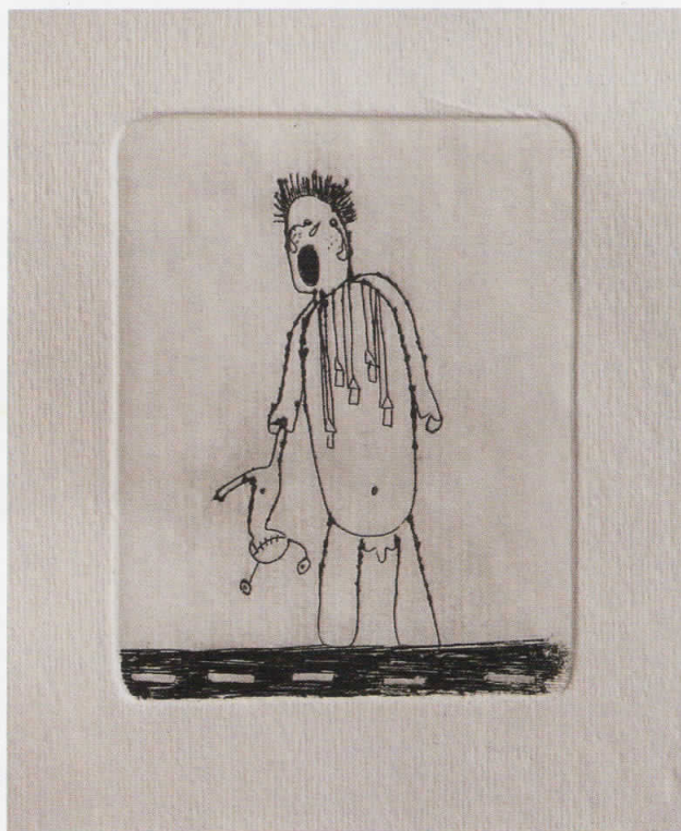
Лошојто дете Хуго, 2008