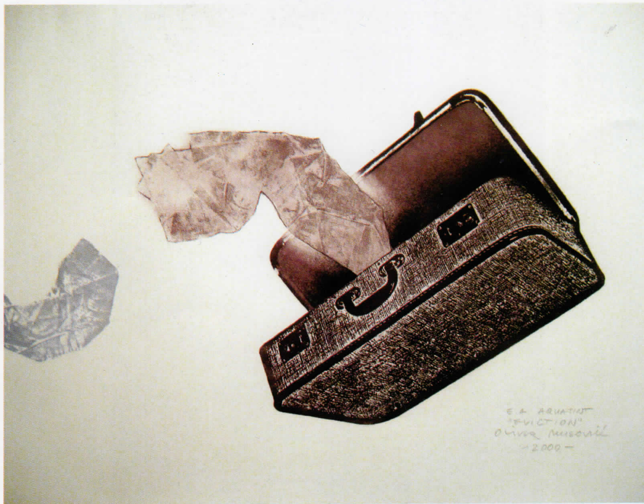
Eviction , 2000 акватинта, 49,6x63,5 cm Eviction , 2000 aquatinta, 40x60 cm