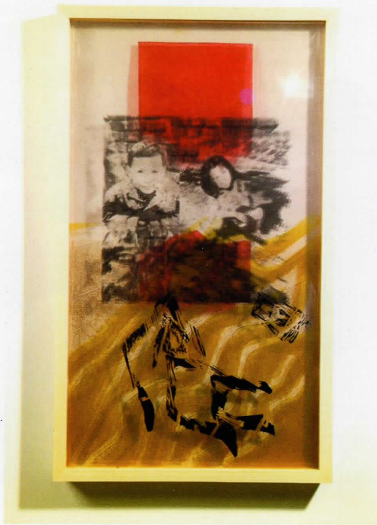
Наша игра , 2005 сито печат линорез, 70x40x10 cm Our Game , 2005 serigraphy, linocut, 70x40x10 cm