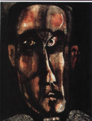
Голооточки портрети (робижаш број 997), 1965