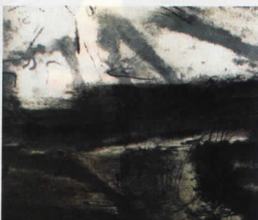
Четири голооточки варијации 2, 1965