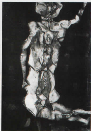
Радикална промена 9, 1961