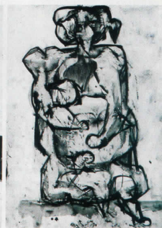
Дејствување на елементите 1, 1957