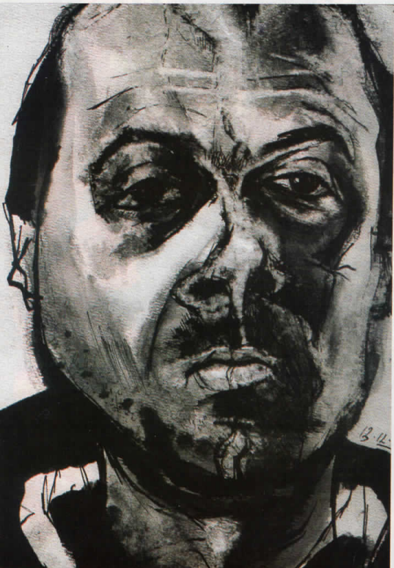
Голооточки портрети (автопортрет 2), 1964