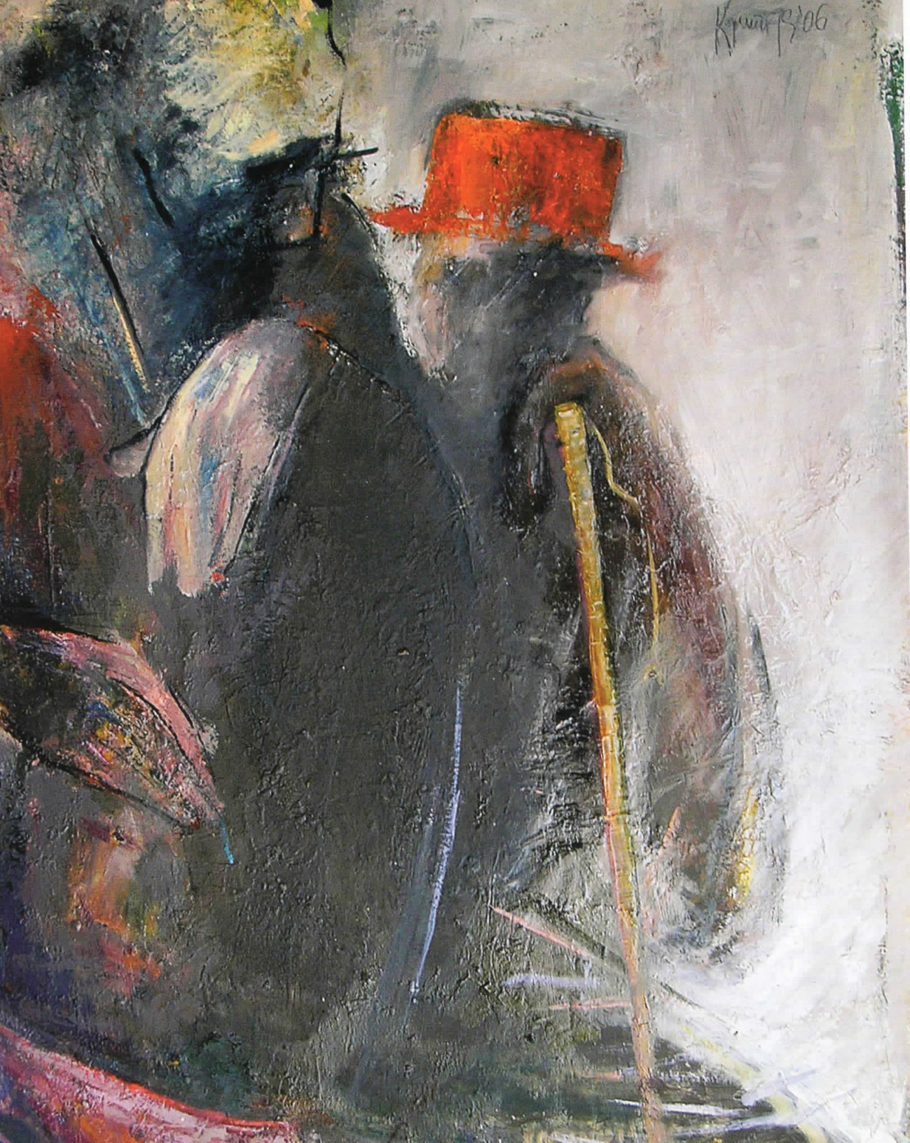
ПРЕКУТЕН ДОГОВОР, 2006, масло на платно, 50 x 70 TACIT AGREEMENT, 2006, oil on canvas, 50x70