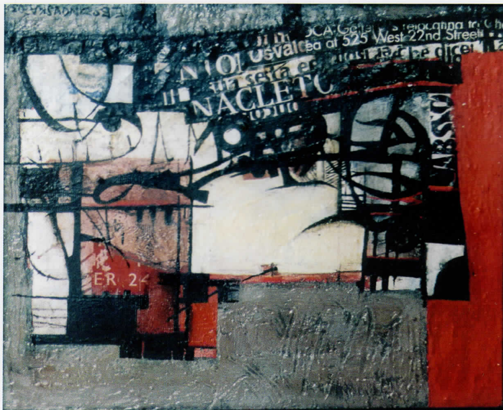
“ДИМИТАР ПАНДИЛОВ” - Емилија Божиновска