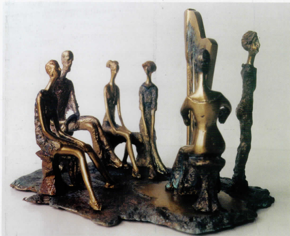
“ДИМО ТОДОРОВСКИ” - Александар Ивановски- Карадаре“