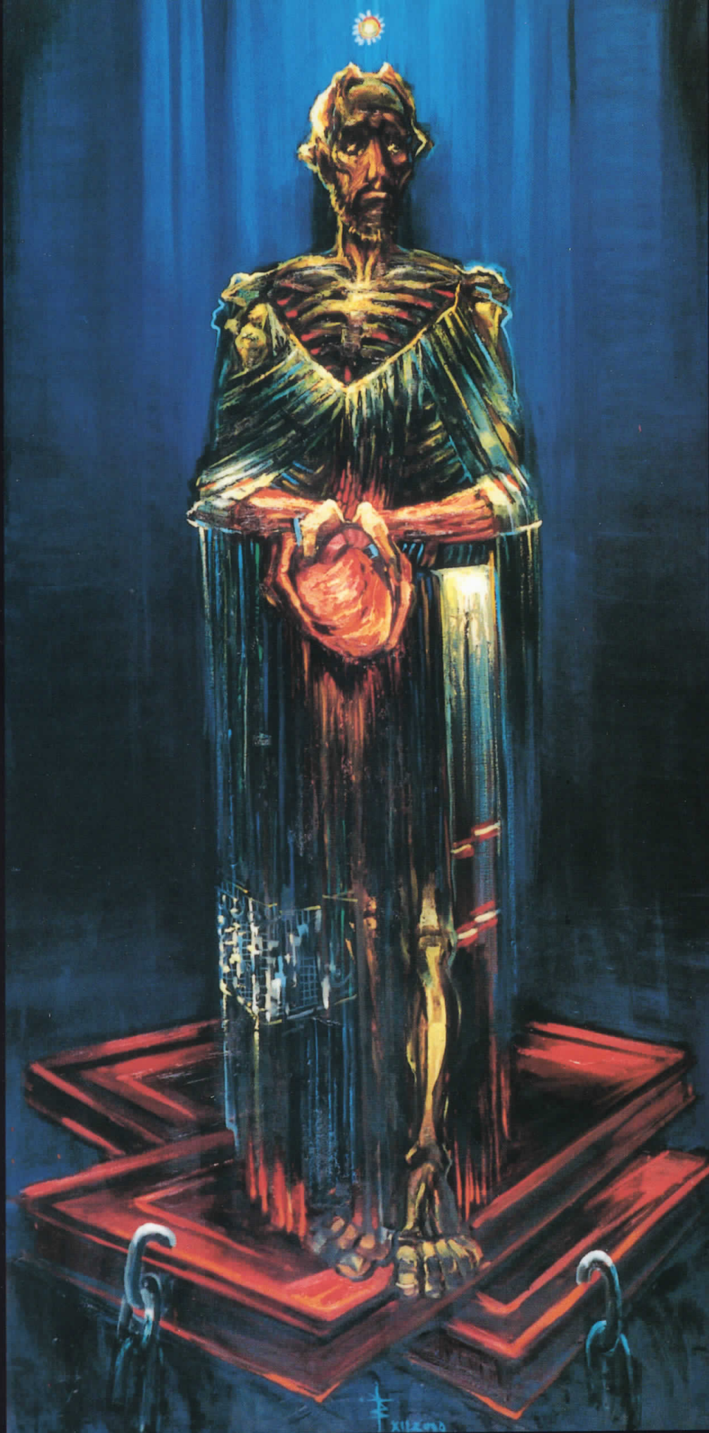
ХРИСТОС ГО ДАРУВА СВОЕТО СРЦЕ масло на платно 2000