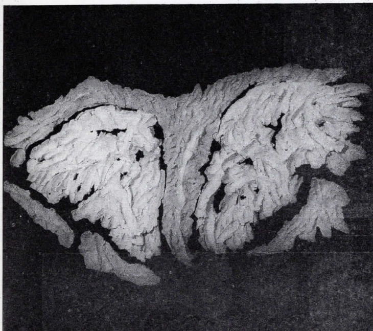
Darija Kačić, Slonovo uvo , 1983, terakota