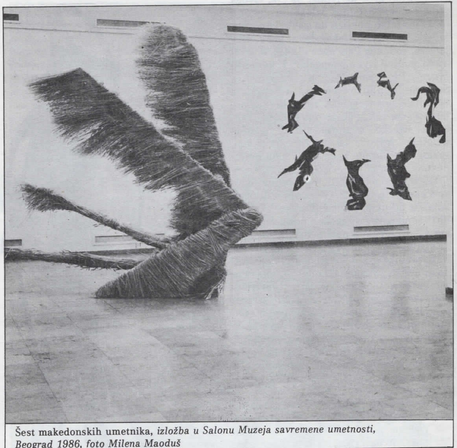
Šest makedonskih umetnika, izložba u Salonu Muzeja savremene umetnosti, Beograd 1986

afirmisani umetnici na širem jugoslovenskom kulturnom prostoru, a toj afirmaciji uveliko je doprinela i već spomenuta sarajevska izložba, mada su oba autora svojim samostalnim nastupima uveliko skrenuli pažnju na njihov rad. Mladi umetnik, Stefanov, već nekoliko godina izvodi prostorne instalacije–skulpture od slame koje su tematski povezane u ciklus »Zmajeva«. U ovom radu oni obuhvataju niz problemskih sklopova aktuelne umetnosti od funkcionisanja predmeta u galerijskom prostoru do ekologije i smisla nove rustičnosti. Svetieva je na prvi pogled bliža klasičnom poimanju skulpture, ali opšti izgled, aranžman i postavka njenih ra-