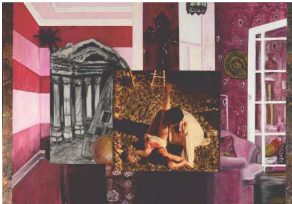
„Витлеем(е)“, комбинирана техника на платно, 70 x 100 cm »Betlehem(e)«, mixed media on canvas, 70 x 100 cm