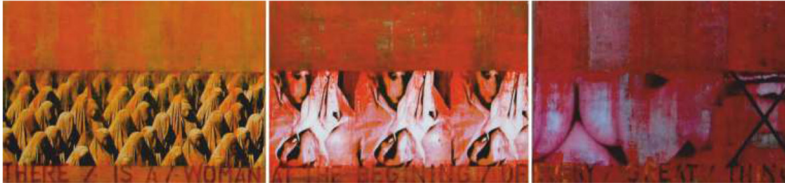
„Три бои црвени: (дис)функција на жената“, комбинирана техника принт, триптих, 50 x 70 cm (x3) „The three colors red: Female (dis)functions“, mixed media, print, triptych, 50 x 70 cm (x3)