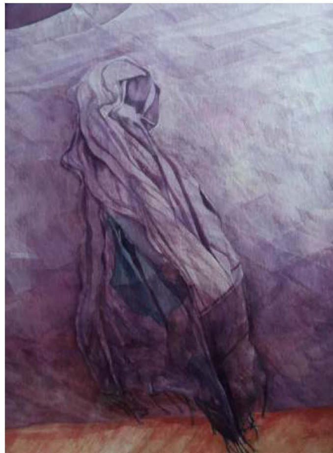
„Меко попладне“, акварел на хартија, 70 x 50 cm »Soft afternoon«, watercolor on paper, 70 x 50 cm