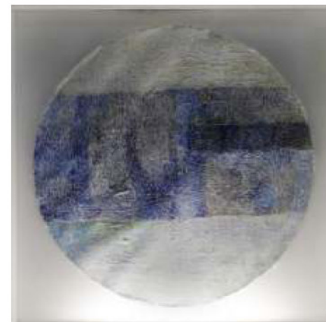
„Via Signum 1, 2, 3“, комбинирана техника на хартија/светлосна кутија (light box), 35,5 / 50 x 40 x 10 cm mixed media on paper/ light box, 35,5 cm/ 50 x 40 x 10 cm