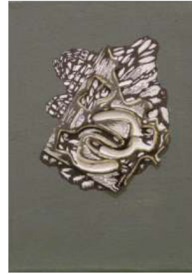
„Без наслов 1, 2, 3“ (од циклусот „Почетококот на сликата“), акрил на платно, 22 x 16 cm »Untitled 1, 2, i 3« ( from the cycle »Beginning of Painting«), acrylic on canvas, 22 x 16 cm