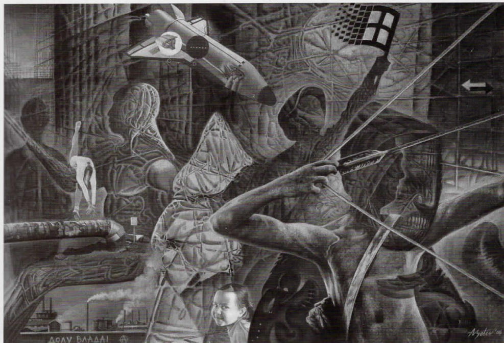
Калина , 2006 акварел и гваш на хартија, 100 x 70