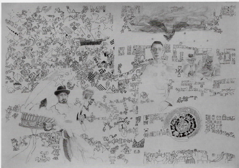
Бостон-Сараево-Пекинг, 2005 туш и молив на хартија, 70 x 50