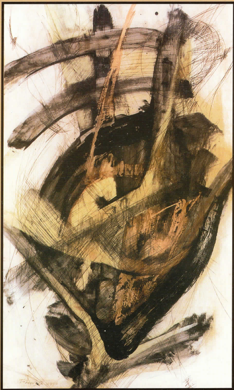
Време NI/MA ; комбирана техника ; 70x40см. ; 1999 Time NI/MA ; mixed tech. ; 70x40sm. ; 1999