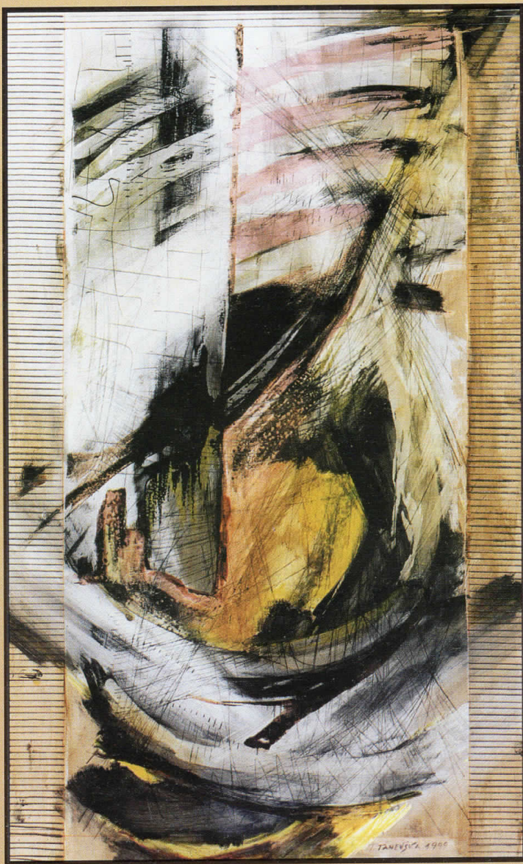
Време Б0-2 ; комбирана техника ; 70x40см. ; 1999 Time B0-2 ; mixed tech. ; 70x40sm. ; 1999