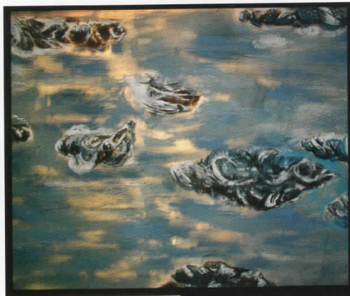
Облаци, 2005 комбинирана техника, 130 x 140 см

τῶν δ' ἔεν καὶ ἄπειρον λεγόντων Ἀ. μὲν Πραξιάδου Μιλήσιος Θαλοῦ γενομένος διάδοχος καίμαθητῆς ἀρχὴν τε καίστοιχείον εἶρηκε τῶν ὄντων τὸ ἄπειρον, πρῶτος τοῦτο τοῦνομα κομίσας τῆς ἀρχῆς. λέγει δ' αὐτὴν μῆτε ὕδωρ μῆτε ἄλλο τι τῶν καλουμένων εἶναι στοιχείων, ἀλλ' ἑτέραν τινα φύσιν ἄπειρον, ἐξ ἧς ἅπαντας γίνεσθαι τοὺς οὐρανοὺς καὶ τοὺς ἐν αὐτοῖς κόσμους· ἐξ ᾧ δὲ ἡ γένεσις ἐστὶ τοῖς οὐσι, καί τινι φθορᾷ εἰς ταῦτα γίνεσθαι κατὰ τὸ χρεῶν· δίδοναι γὰρ αὐτὰ δίκην καὶ τίσις ἀλλήλοις τῆς ἀδικίας κατὰ τὴν τοῦ χρόνου τάξιν, ποιητικωτέροις οὕτως ὀνόμασις αὐτά λεγῶν.