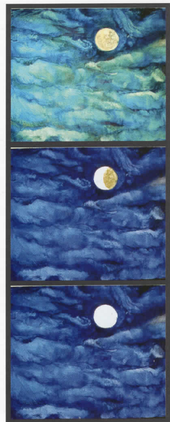
Месечина, 2005 комбинирана техника, 100 x 140 см