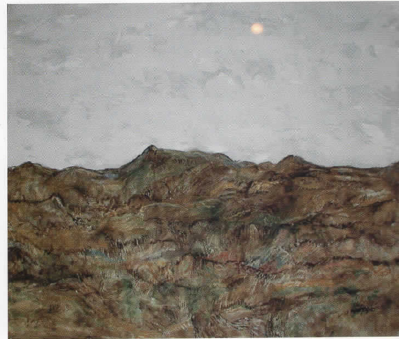
Сонце, 2005 комбинирана техника, 100 x 140 см

Ἄ. δεῦρυ στρατοῦ Μιλήσιος, εἰαῖρος γεγενηὸς Ἀναξιμανδρῶν, μίαν μὲν καὶ αὐτὸς τὴν ὑποκειμένην φύσιν καὶ ἀπειρον φησὶν ὡς περ ἐκείνος, οὐκ ἀόριστον δὲ ὡς περ ἐκείνος, ἀλλὰ ὠρισμένην, ἀέρα λέγων αὐτὴν· διαφέρειν δὲ μανότῃ καὶ πυκνότητι κατὰ τὰς οὐσίας. καὶ ἀραιούμενον μὲν πῦρ γίνεσθαι, πυκνούμενον δὲ ἄνεμον, εἴτα νέφος, εἴτα δὲ μᾶλλον ὕδωρ, εἴτα γῆν, εἴτα λίθους, τὰ δὲ ἄλλα ἐκ τούτων. κίνησιν δὲ καὶ αἰθίουτος αἰδίου ποιεῖ, δι' ἣν καὶ τῆς μεταβολῆν γίνεσθαι.