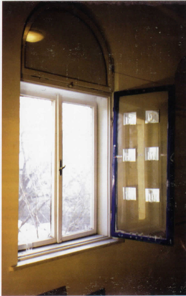
Bedi Ibrahim, My diary, 2002.