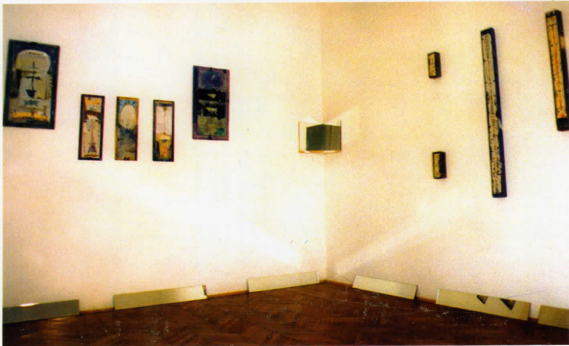
Bedi Ibrahim, My diary, 2002.