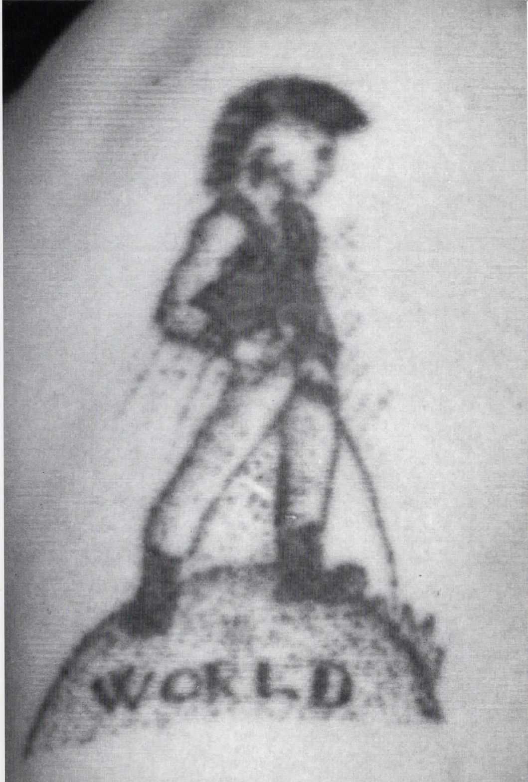
ready-made WORLD, (детал/detail)