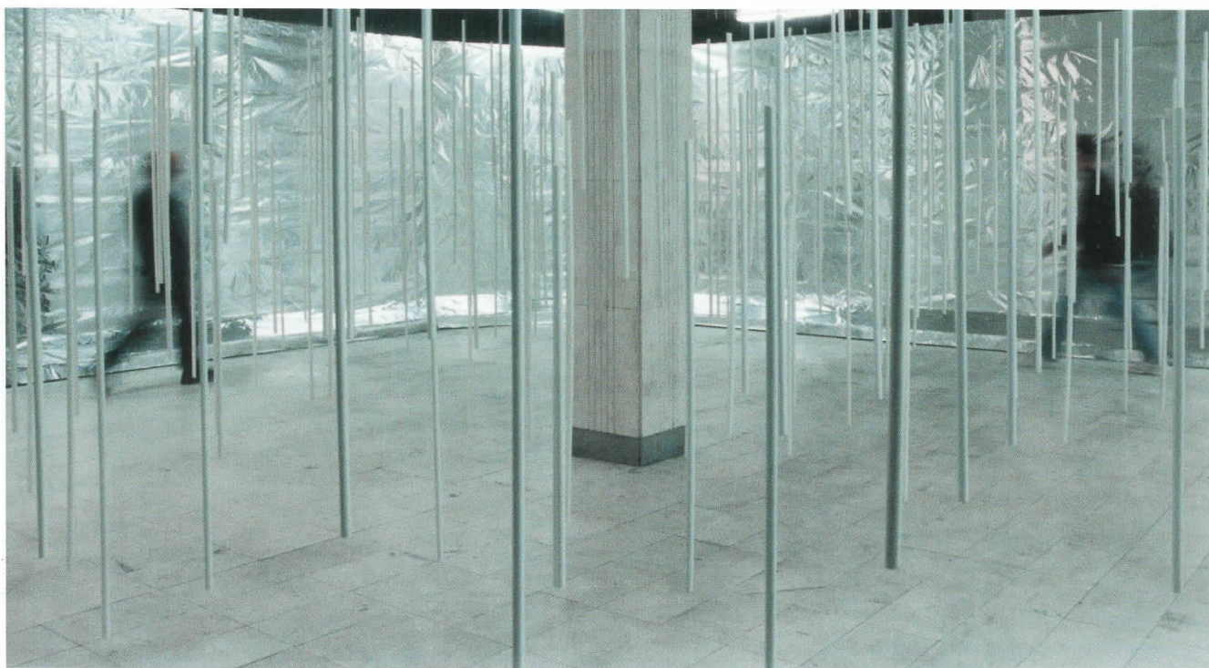
Пештера, инсталација; алуминиумска фолија, пластични цевки / Cave, installation; aluminum folie, plastic pipes