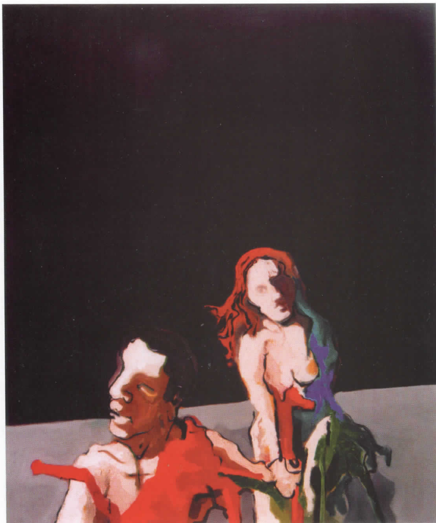
ШИПШИЌ ДАРКО - Масло на платно (130 x 150)