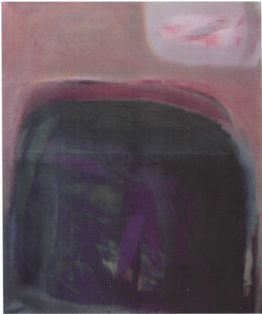
ЛОЗАНОСКИ ДИМЧЕ - Масло на платно (100 x 120)