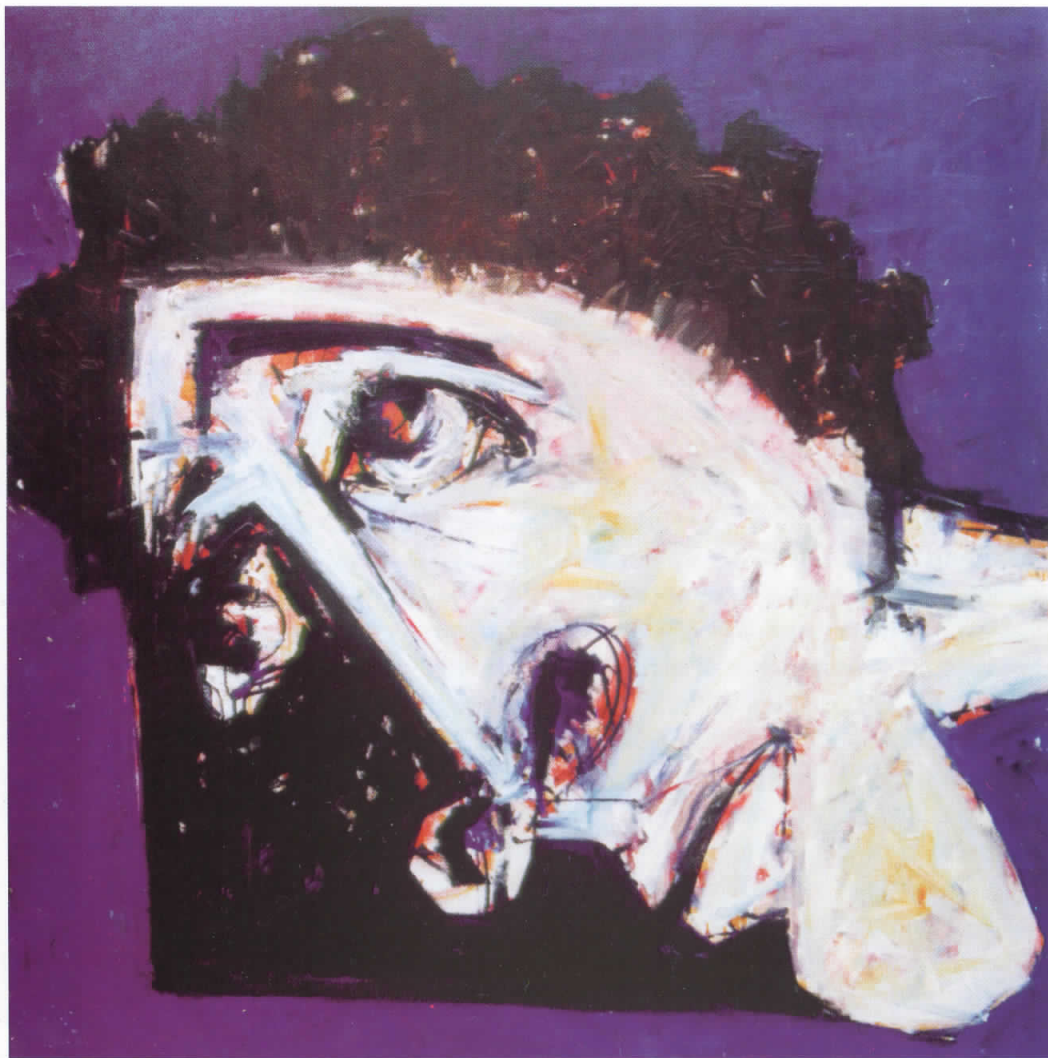
МИЛОШЕСКИ ЉУБОМИР - Масло на платно (160 x 160)