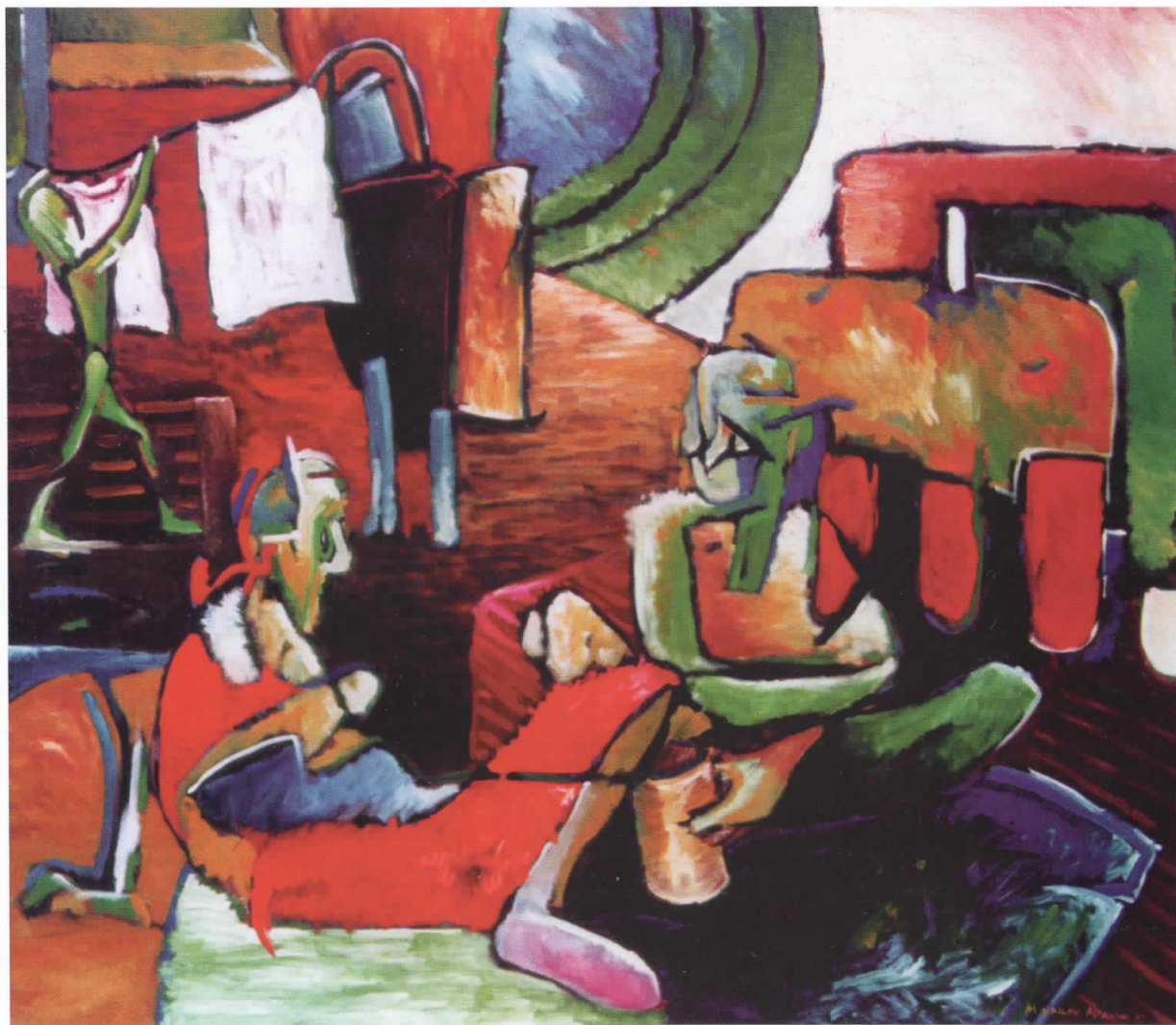
МИХАЙЛОВ АСПАРУХ - Масло на платно (130 x 150)