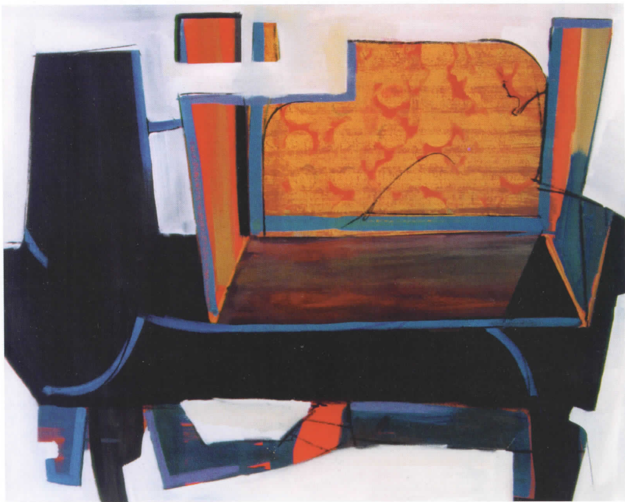
ТИМЧЕВСКИ СЛОБОДАН - Масло на платно (80 x 100)