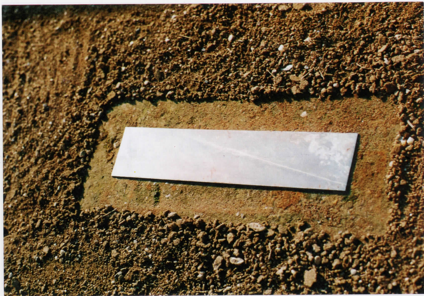
6. Објект VI, 1994 Објект VI, 1994 метал и земја, 200x60см.