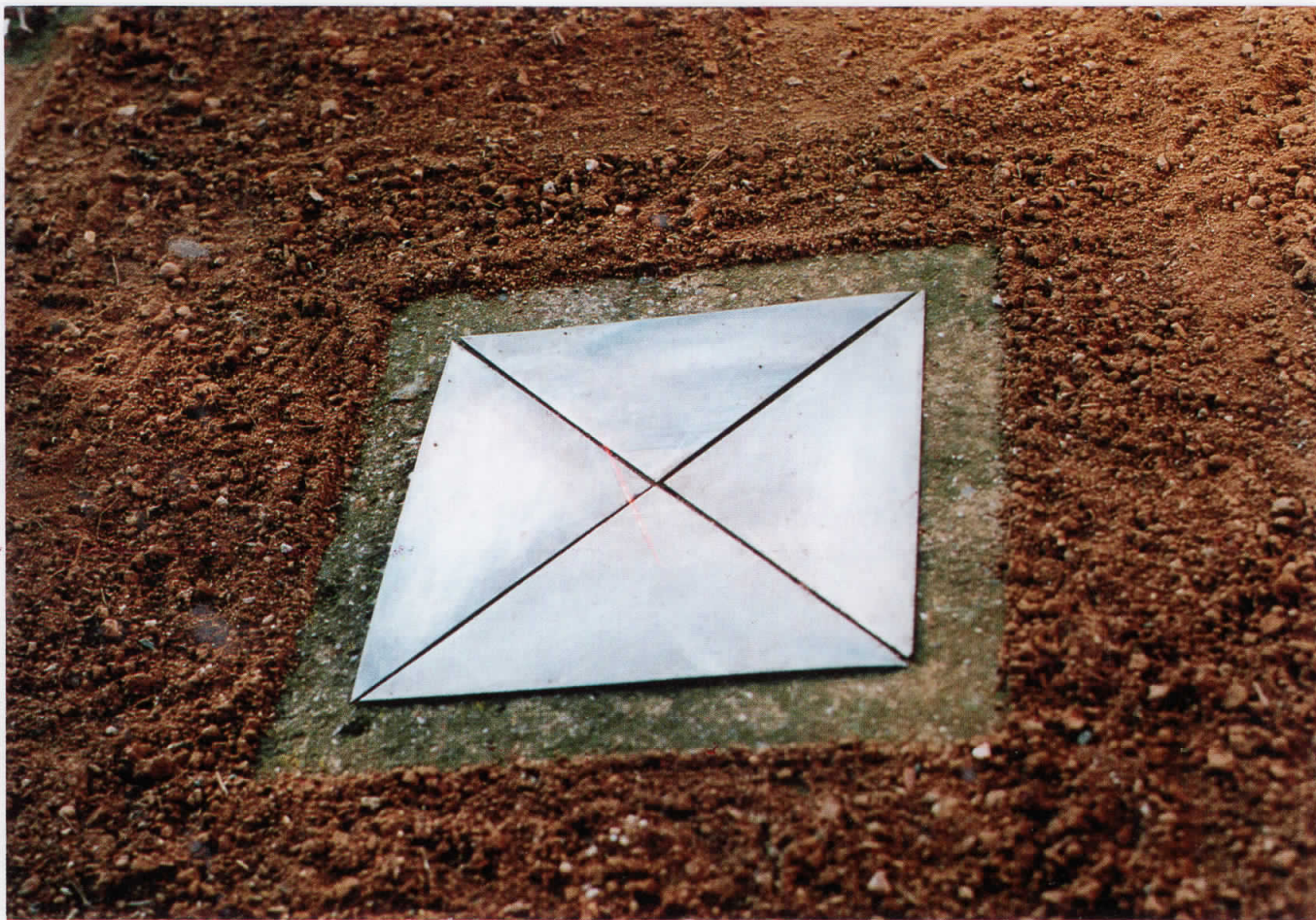
5. Објект V, 1994 Object V, 1994 метал и земја, 125x125x3cm.