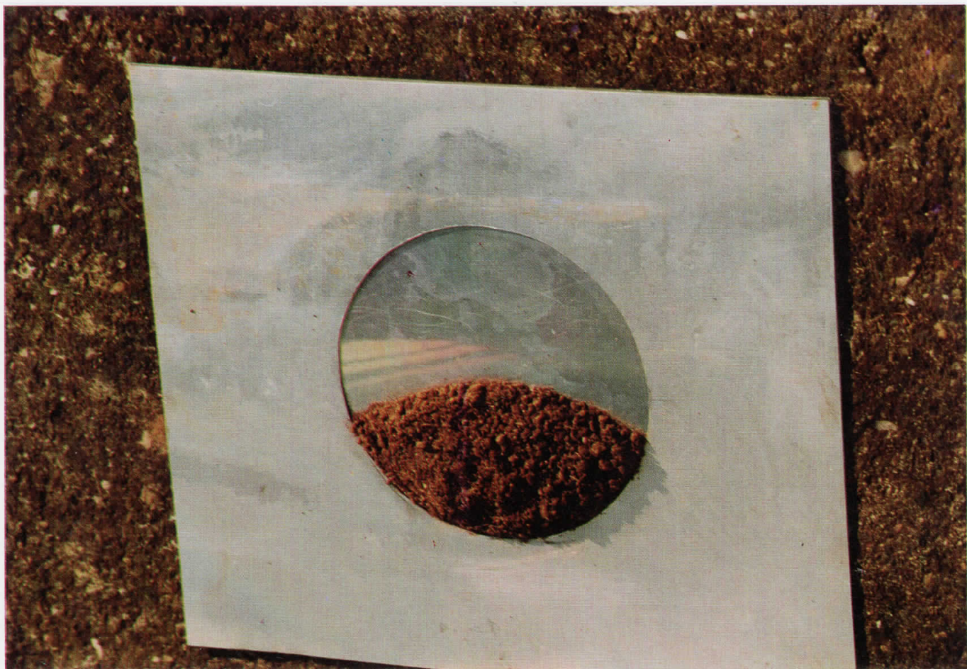
3. Објект III, 1994 Object III, 1994 метал и земја, 125x150x8см.