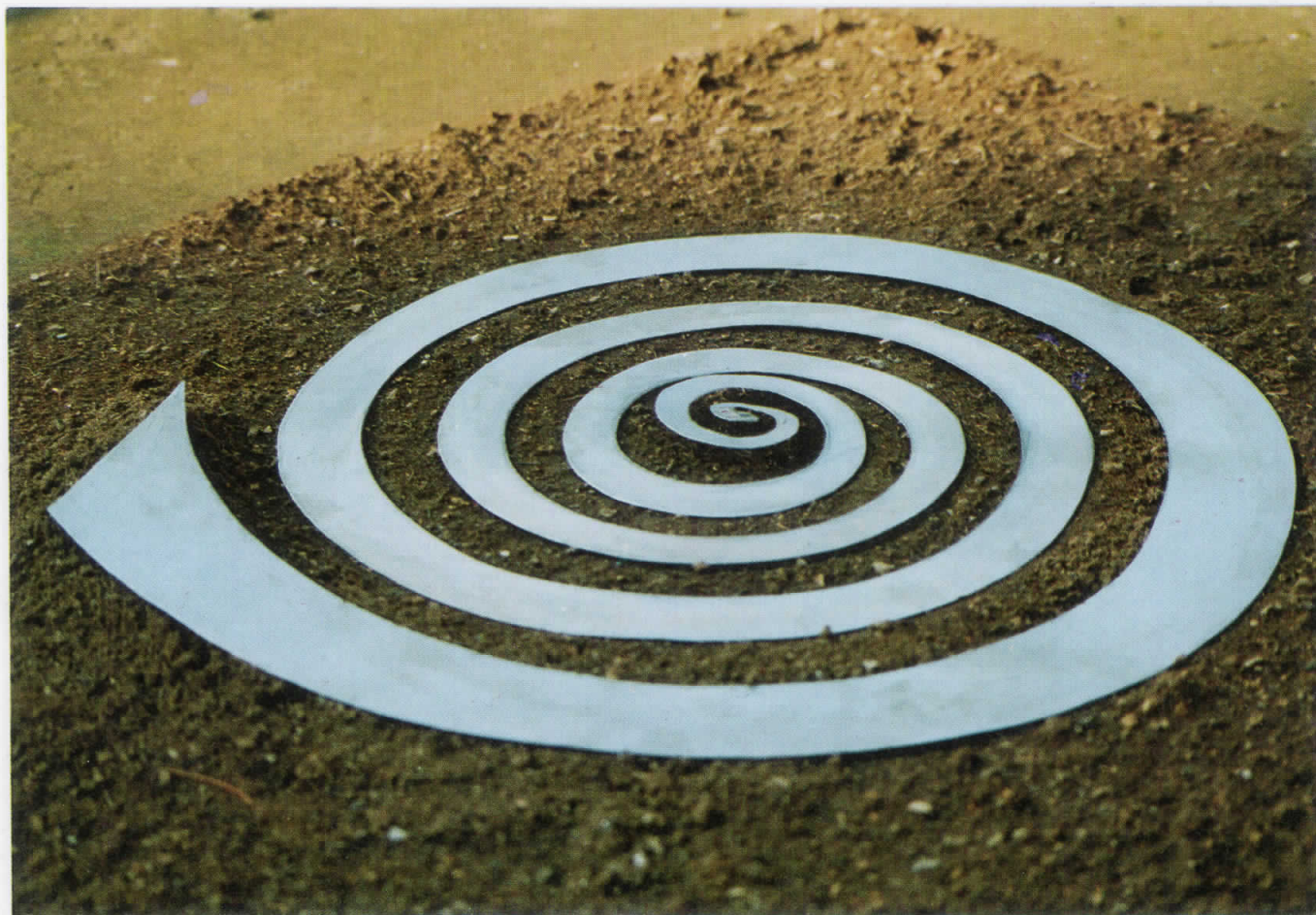
1. Објект I, 1994 Object I, 1994 метал и земја, 250x250x5см.

Од проектот "Наспроти" From the project "The Opposite"