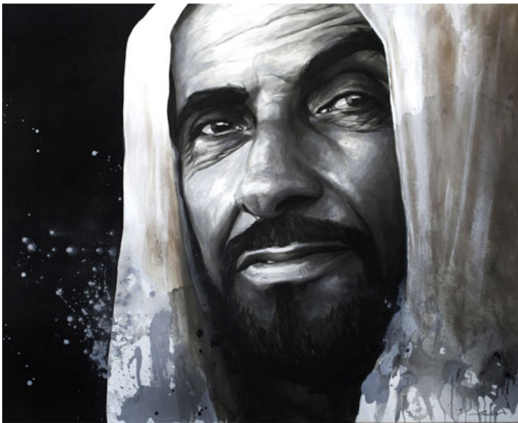
Шеик Зајед бин Султан ал Нахијан