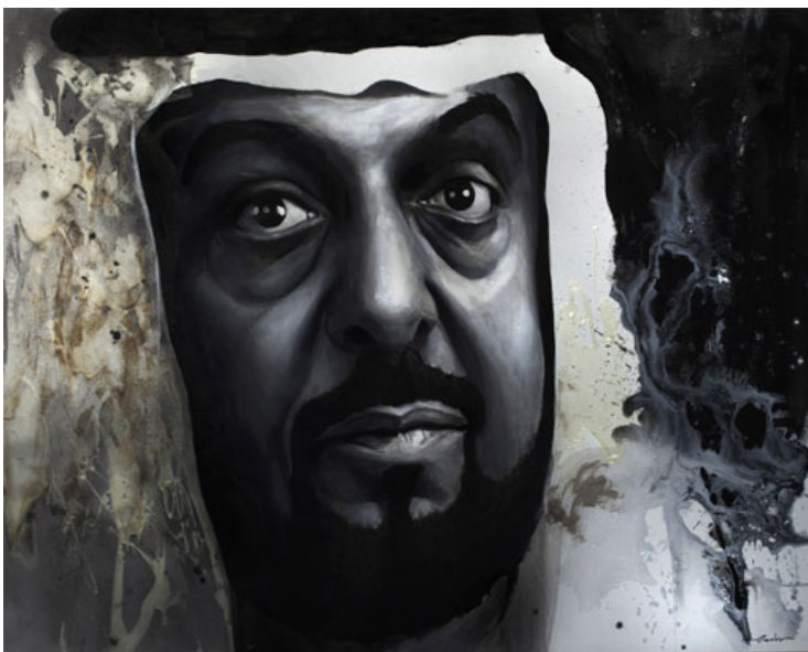
Шеик Калифа бин Зајед ал Нахијан

На крајот од овој студиски престој создадените дела ги презентиравте на заедничка изложба. Кој се' дојде на нејзиното отворање, какви дела и каде создадовте и презентиравте и што можете да издвоите од изложбата во овој се' поатрактивен светски центар?