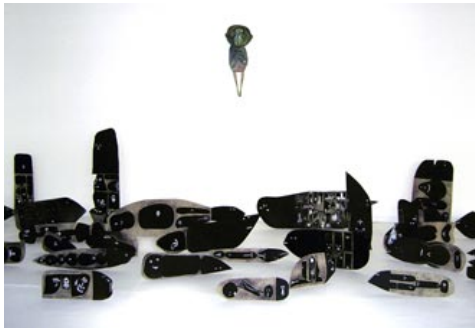
Инсталацијата „Лош ден за господинот Еузебио“

„ Со надреализмот и дадаизмот уметноста за прв пат оди радикално во некои други правци. Салвадор Дали беше мој херој од средно училиште, но јас ги почитувам сите движења, сите култури, за мене сите се голема инспирација“.