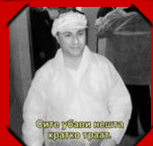
Сите убави нешта кратко траат