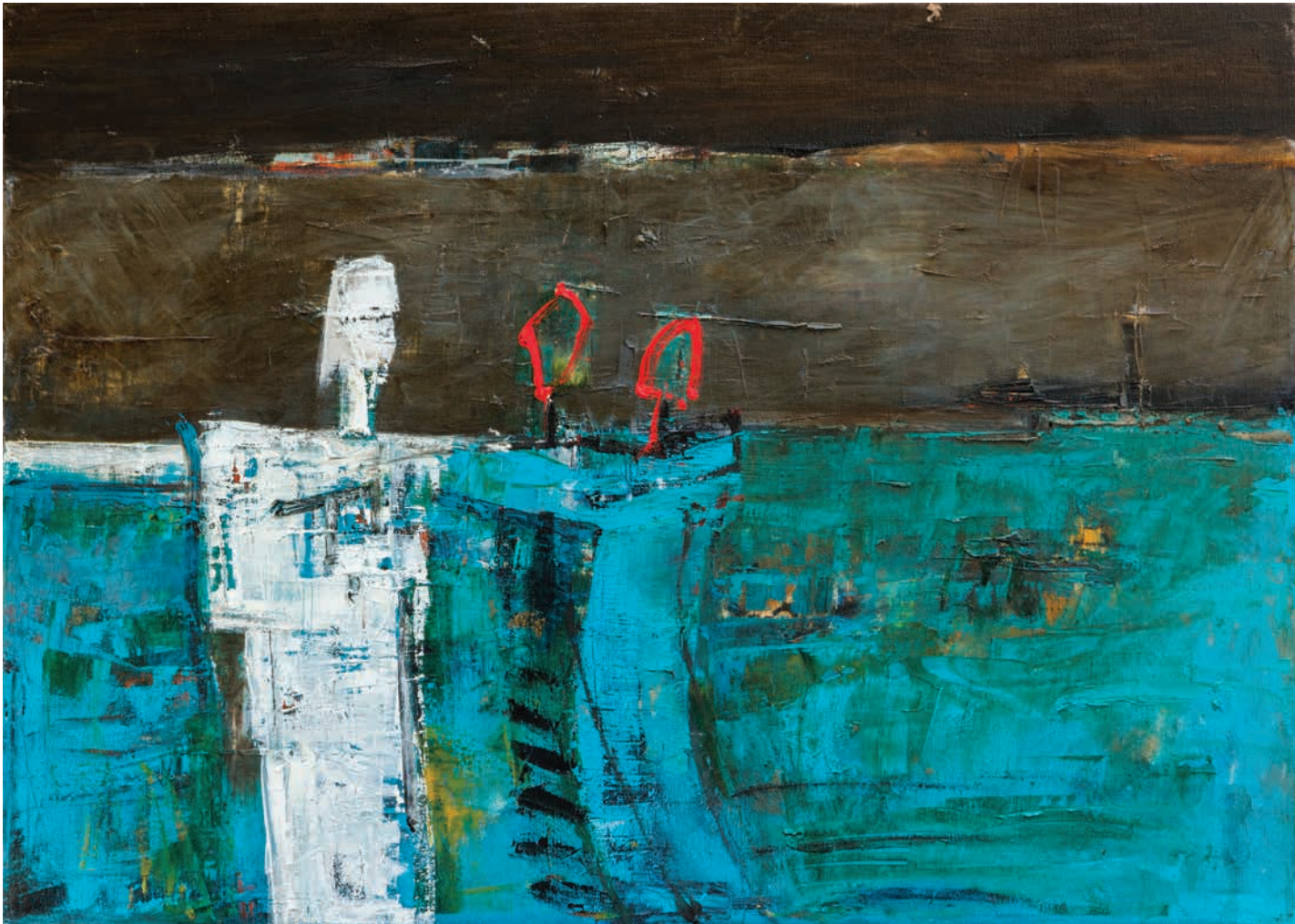
Населени соништа Settled dreams

50x70cm масло на платно-oil on canvas 2015