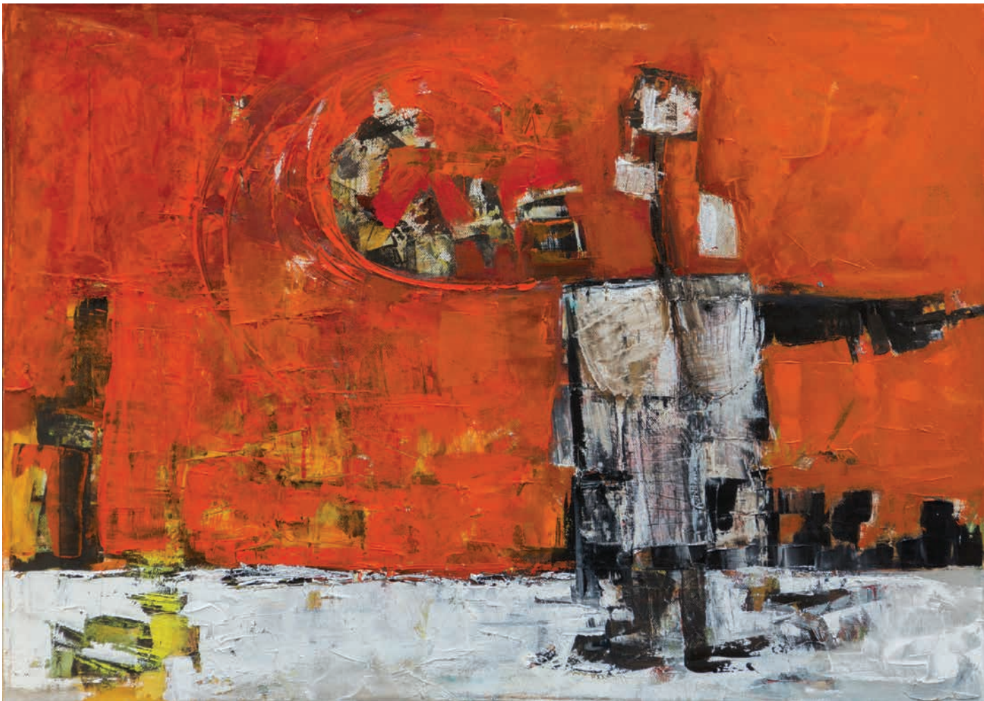
Во паузата на претставата In the break of the performance

50x70cm масло на платно-oil on canvas 2014