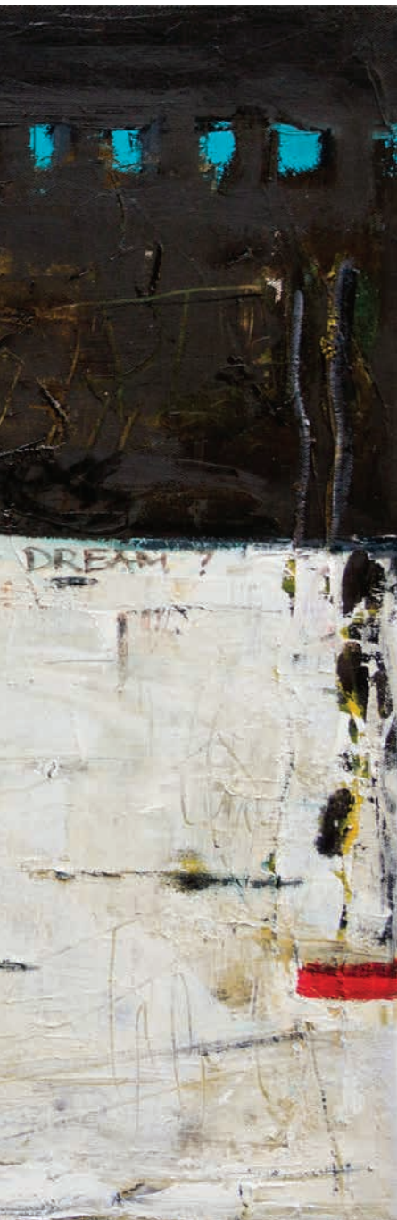
Зошто да ги отворам очите од лажниот сон Why should I open my eyes from the delusive dream 50x70cm масло на платно-oil on canvas 2015