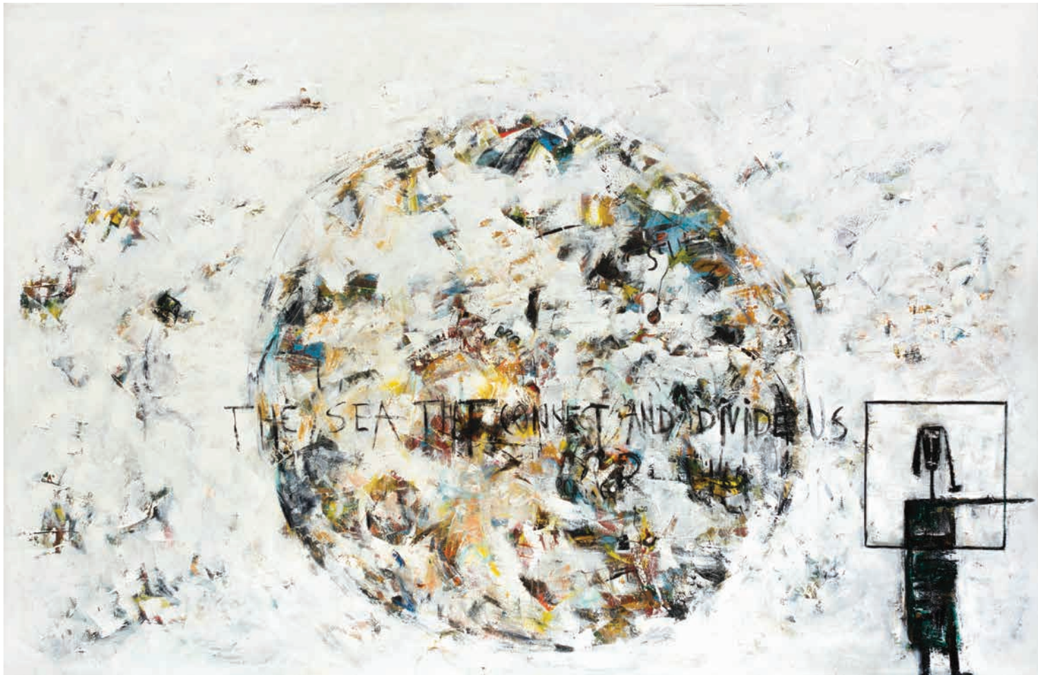
Меѓу нас тече морето кое не одредува и не разделува The sea, which determines and separates us, flows between the two of us 130x400cm масло на платно / oil on canvas 2015