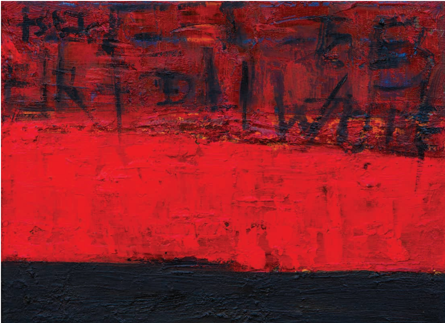
Сећавања и заборави Memories and oblivions

18x24cm масло на платно-oil on canvas 2015