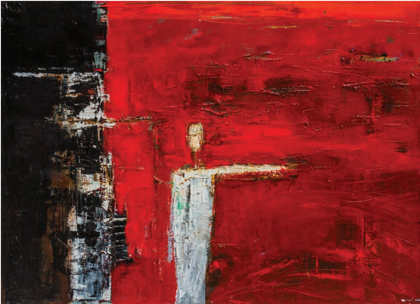
Дел од спокојот Part of tranquillity

50x70cm масло на платно-oil on canvas 2015