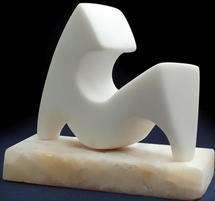
AKT NUDE 10x9,5x5cm мермер/marble