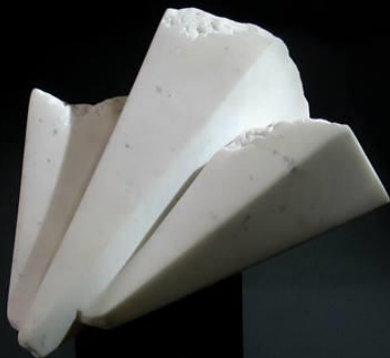
АСОЦИЈАТИВНА ФОРМА ASSOCIATIVE FORM 25x20x27cm мермер/marble