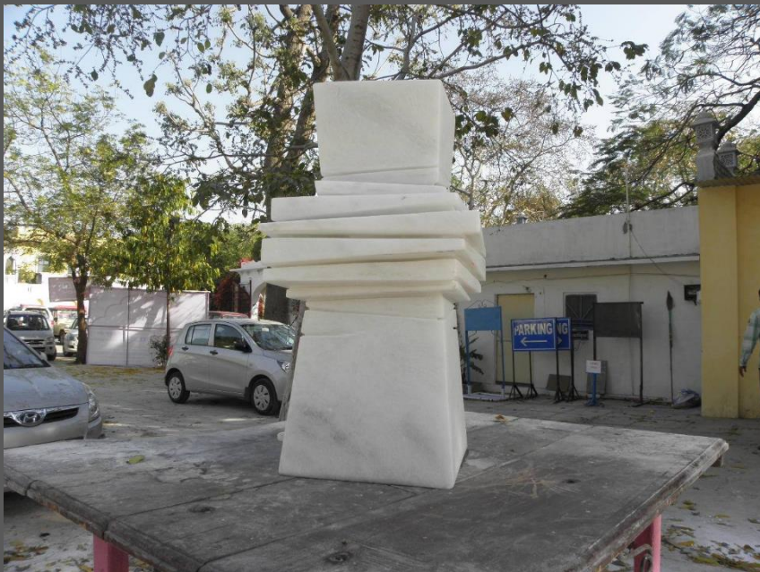
ВЕРТИКАЛНА ФОРМА VERTICAL FORM cm мермер/marble