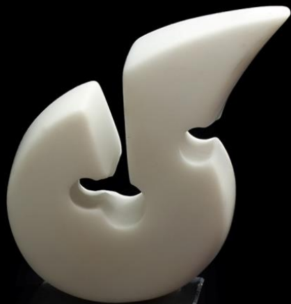
СТРАДАЊЕ DISTRESS 10x10x6cm мермер/marble