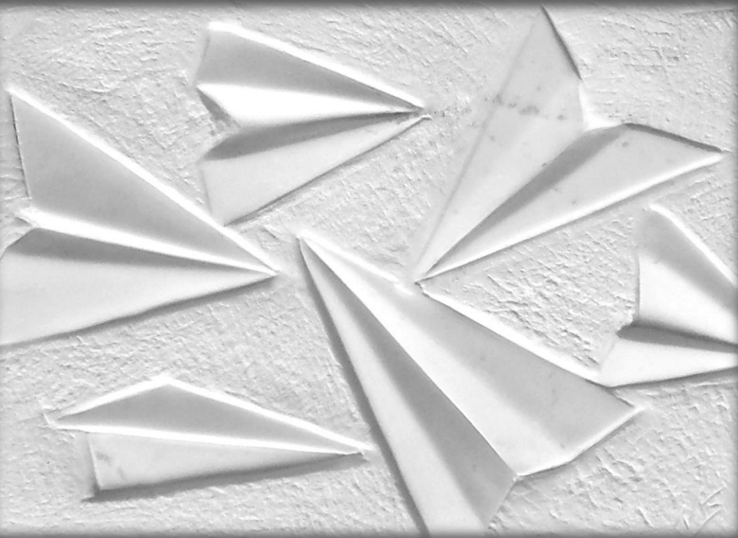
ДЕТСТВО CHILDHOOD 40x30cm мермер/marble