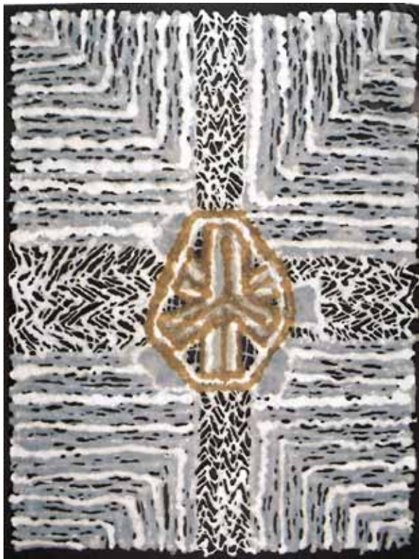
„Сонце 1” 100x75 (1997)