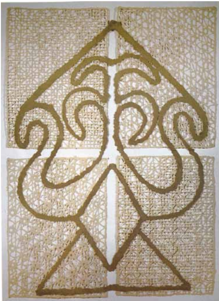
„Голема жена 2” 200x140 (1997)