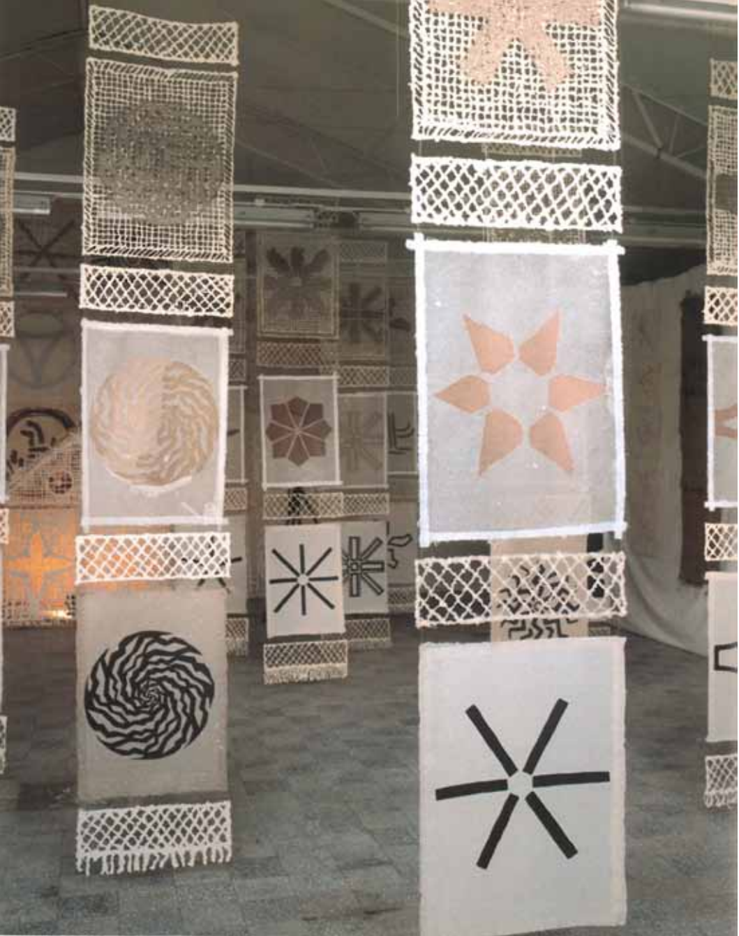
„Куќа на сонцето“ поглед на инсталација од рачно изработена хартија, (1992/2000)