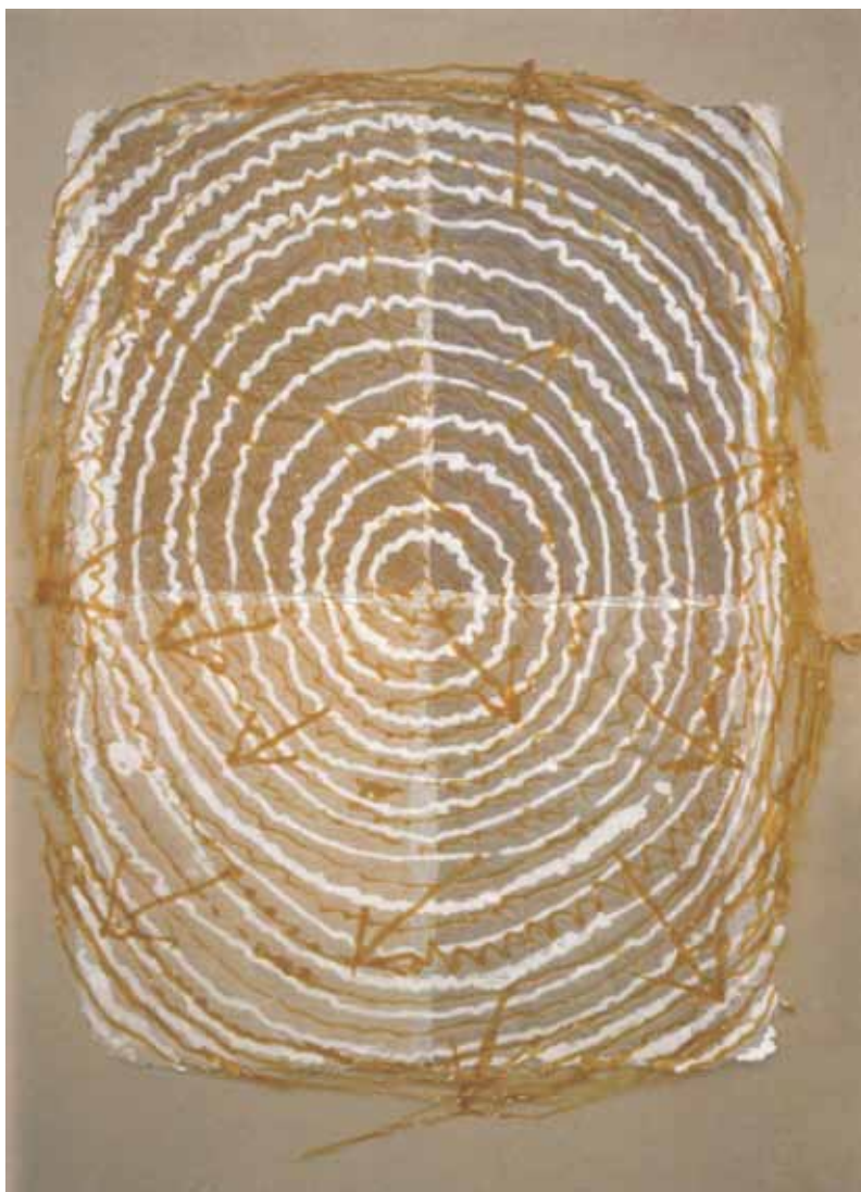
„Сонце VII“ 98x73 (1997)

Од 2000 до 2003 година работи како автор и координатор на проектите на програмите на Унеско (Париз) и Темпус (Брисел). Последниот проект Медиум Целулоза при Темпус програмата, се реализира во соработка со Германија (Академијата за ликовни уметности Нирнберг) и Италија (Интернационалната графичка школа, Венеција. Председател е на невладината организација „Медцел“ - професионални уметници на хартијата, дизајнери и изработувачи на ориентална и европска рачно правена хартија. Објавил еден научен труд и едно универзитетско помагало за „медиумот целулоза“.