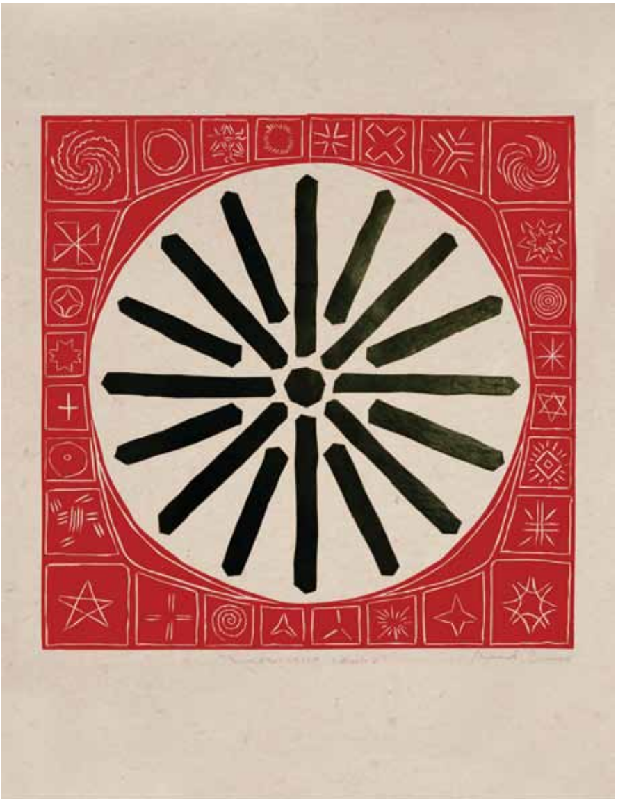
„Македонско сонце 1” 90x60 (1998/99)