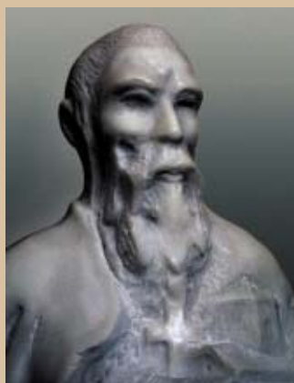
СВ. КЛИМЕНТ ОХРИДСКИ