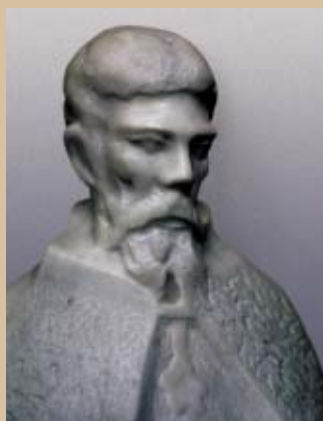
СВ. НАУМ ОХРИДСКИ