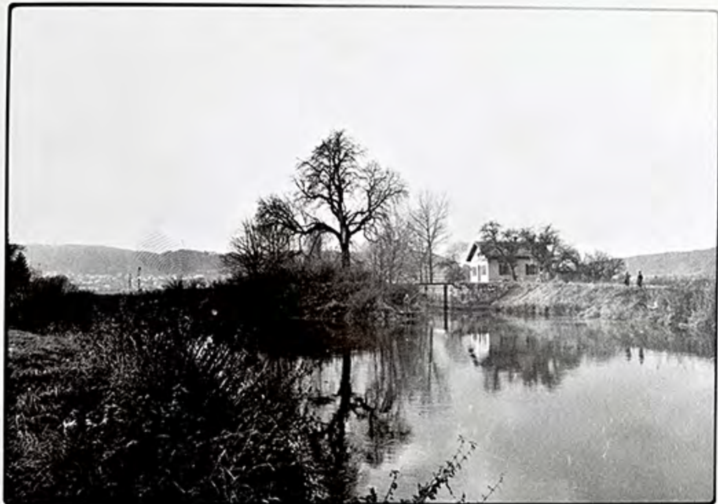
STICH Gerhard Fisherhütte am Chiemsee